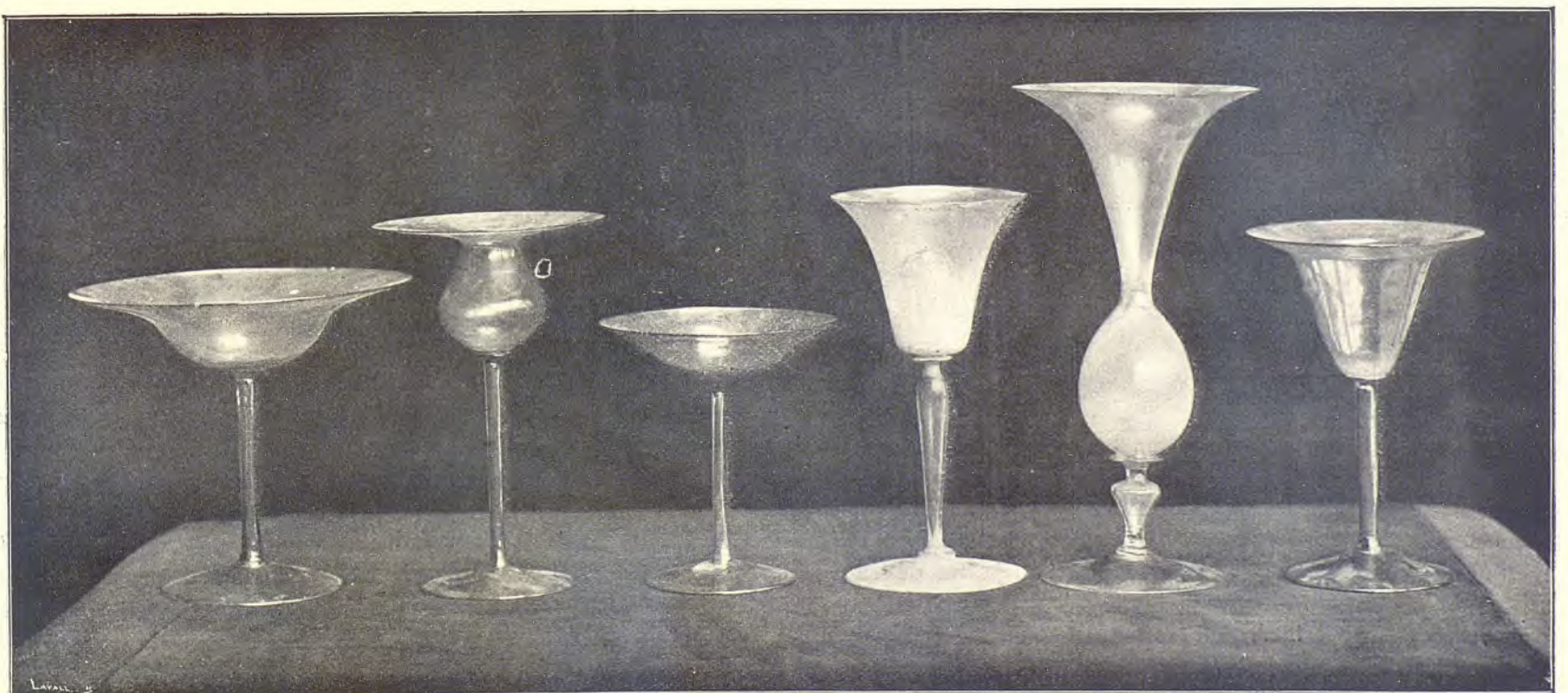
Vidrios antiguos de la colección A. de Riquer