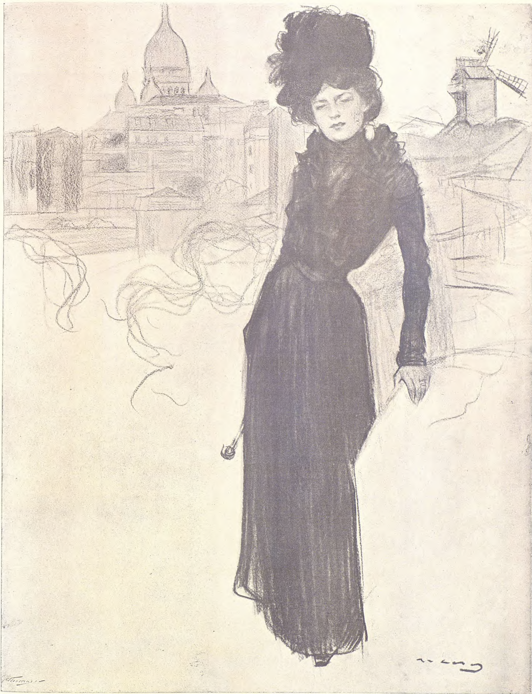
LA MUSA DE MONTMARTRE