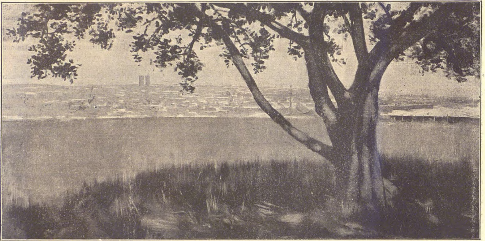
ESTUDIO DEL NATURAL