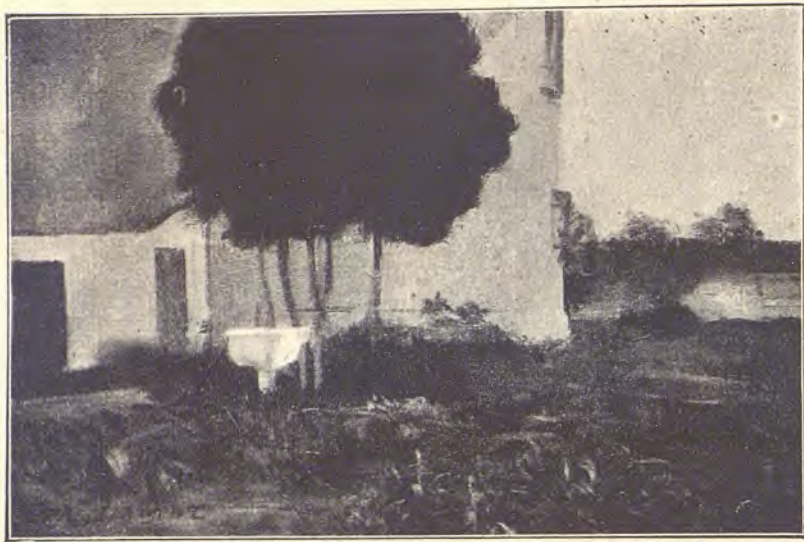
EL VINYET (SIRJES)