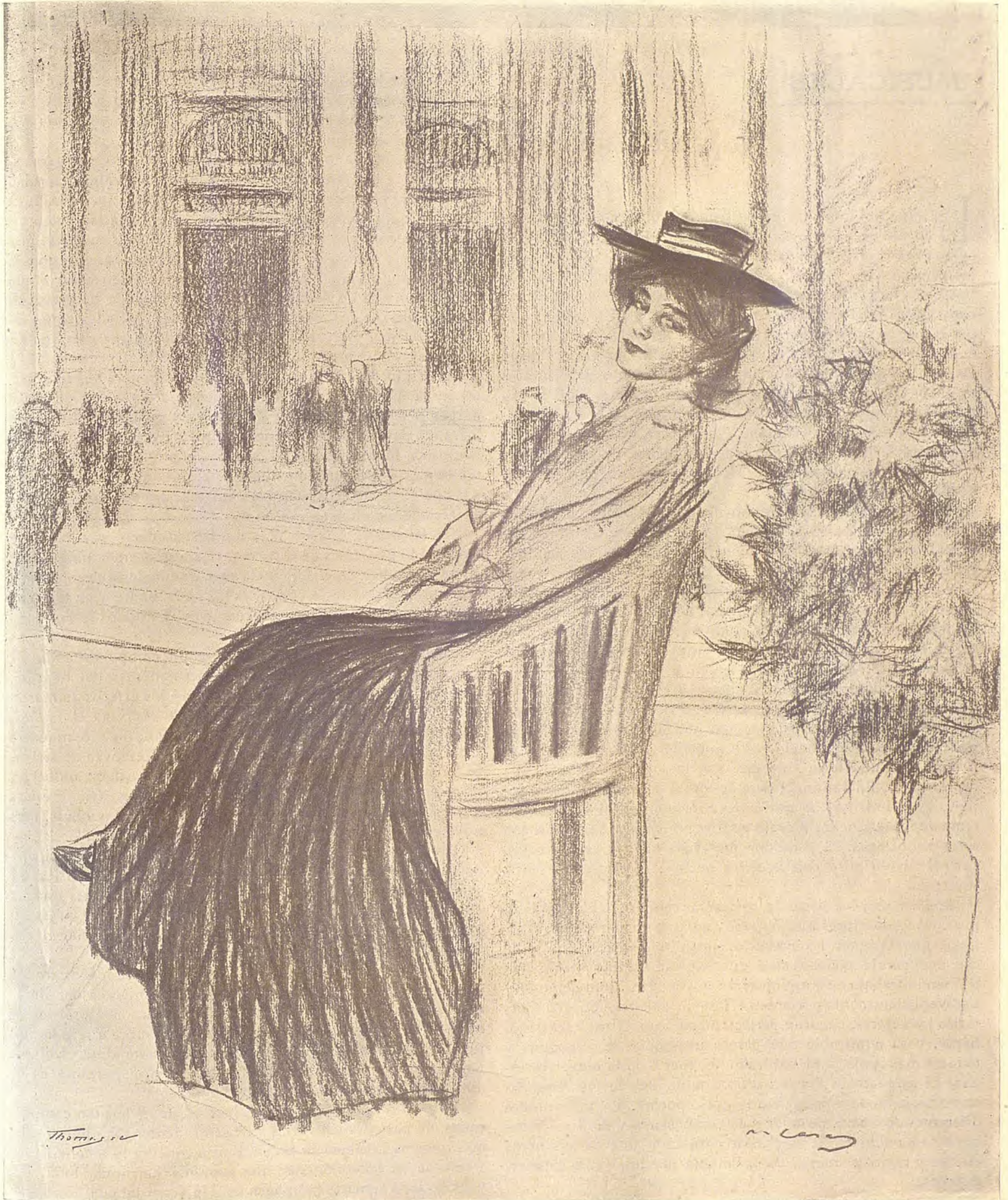
EN LA ESPLANADA DE LOS INVÁLIDOS, por R. CASAS