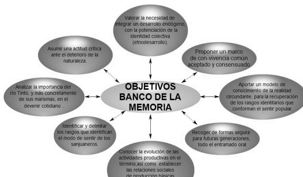
7 A pesar de cómo se ver así Figura 4. Objetivos de banco de la memoria sanjuanera. Elaboración propia.

Del mismo modo, partimos en nuestros objetivos del pensamiento ecologizado de Edgar Morín (1986), concibiendo al ser humano, desde una perspectiva eco-bio-físico-emo-mentalo-noológica. , de ahí que tanto objetivos como el resto del diseño del programa tenga una perspectiva de miras amplia y global. De forma sintética, los objetivos que guían todo el proceso, se articulan a través de ocho grandes campos 7 :