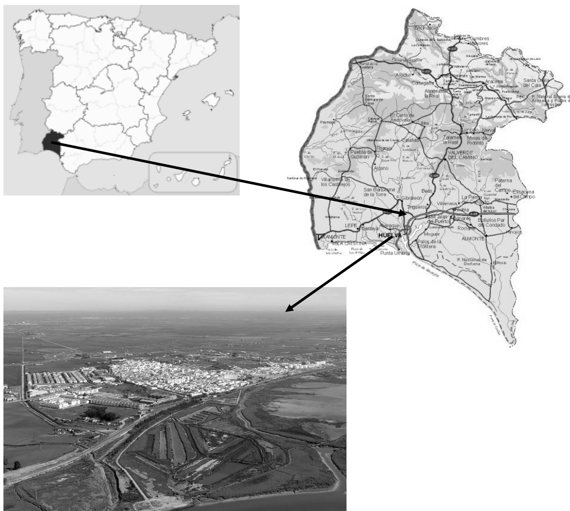
Figura 3. Localización de San Juan del Puerto en el contexto español.

la generación de marcas constitutivas de diferencia respecto a poblaciones del entorno. Del mismo modo, la familia y las relaciones que se establecen en lugares con una significatividad muy específica ocupan un lugar privilegiado en sus comentarios, así como las delimitaciones entre el mundo público, privado e íntimo.