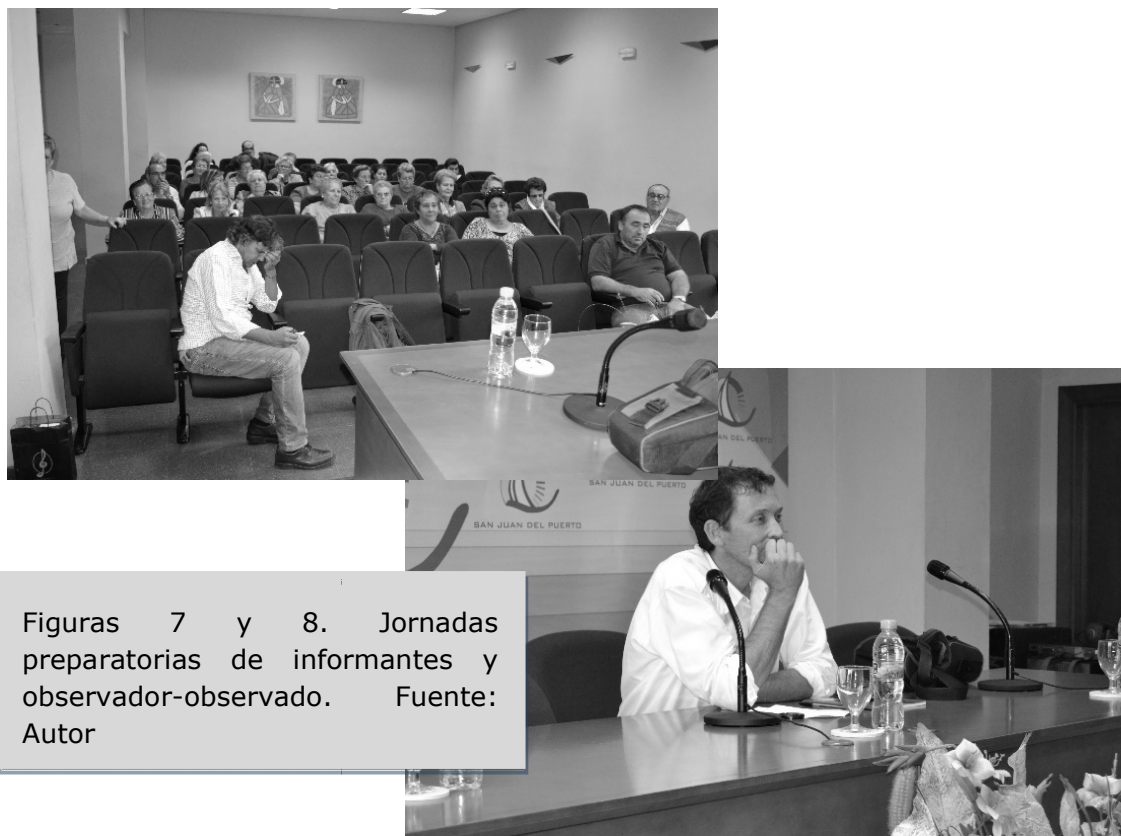
Figuras 7 y 8. Jornadas preparatorias de informantes y observador-observado.

Todas estas entrevistas y toma de muestras, han permitido poder elaborar un primer esbozo de la forma de apreciación de los lugares en el marco del imaginario sanjuanero (figura 9), así como la forma de recreación de las memorias 13 , la cual gira alrededor de cuatro grandes dimensiones. Cada dimensión representa los diferentes pilares sobre los que se produce una apropiación simbólica del espacio,