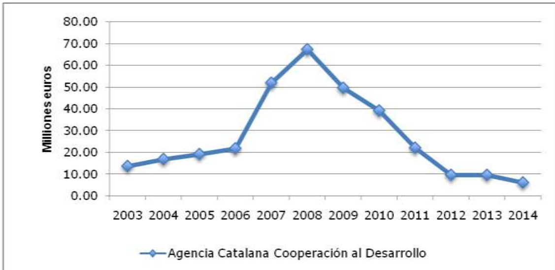
Gráfico 1: Reducción presupuestaria de la partida de cooperación al desarrollo.