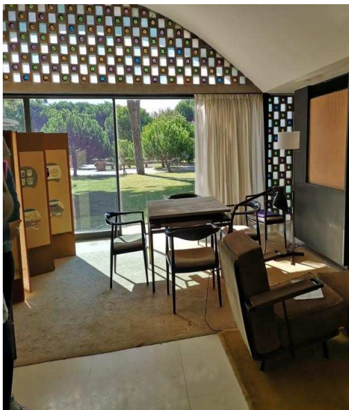
Foto 1. Taula de treball al sortir del jardí. (Enric Aranda Nieto, 28/9/2018 CC).

Pel que respecta a les nostres pròpies sensacions, en canvi, ens agradaria dir que les opinions dins del grup van ser polaritzades. A uns la construcció ens va semblar familiar i acollidora, mentre que als altres ens va semblar més freda. En el que vam coincidir sens dubte, però, és que el discurs que acompanyava la visita guiada estava totalment encarada a alumnes amb coneixements tècnics; concretament d'estudis de disseny i arquitectura. De totes maneres, vam poder aprofundir en les nostres qüestions personals a través de l'entrevista realitzada a la Marita al final de la visita del segon grup. Per aquest motiu (les limitacions de discurs i les restriccions explicatives sobre la casa) és pel que a continuació proposarem una sèrie de mesures d'intervenció per tal que un ventall més ampli de públic (sobretot gent del Prat) tingui l'oportunitat de gaudir i entendre els orígens de la casa.