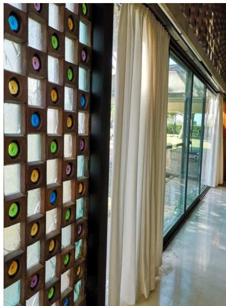
Foto 2. Interior de la Ricarda. Enric (Aranda Nieto, 28/9/2018 CC).