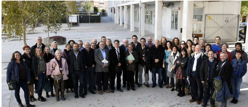
Acte d'homenatge a la Universitat Rovira i Virgili (Tarragona, 2016)

En aquest sentit jo encara he conegut personatges, he sigut coetani de Foucault i Lévi-Strauss. Penseu que quan jo estava a París Lévi-Strauss donava classes al Collège de France i no em vaig atrevir mai a anar a una classe seva per una raó de timidesa! No em sentia amb valor! Hi hagués pogut anar perquè era obert i hi anaven les senyores amb abric de pells (perquè el Collège de France va així) però jo he tingut una espècie de timidesa personal que no m'atrevia a anar-hi. Jo he viscut en aquest món i sóc conscient - i per això m'he jubilat- de que sóc el final d'una etapa. Amb això no vull dir que abans fos millor que ara, no; és diferent. Moltes vegades també dic que el què em sap greu és lo que em perdré. Però sí que s'ha d'entendre que sóc producte d'un context històric bastant determinant que no té res a veure amb la revolució cultural que s'està produint ara. Estem en una revolució cultural per mi equivalent a la de Gutenberg, però amb una diferència radical: la de Gutenberg va costar dos-cents anys consolidar-se; la d'ara s'ha consolidat en deu anys. Com totes les revolucions, encara no s'ha estructurat i no sabem cap a on anem. Aleshores el meu món és com el món que descriu Proust a finals de la tercera República francesa, o el que explicava Visconti a la seves pelis històriques, que és un final d'època. Doncs la meva posició és exactament semblant: jo també sóc el final d'una determinada època, d'un determinat món.