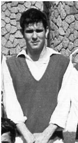
Els anys de Medicina 1966-72

cine que tenia unes característiques fortament documentals i després molt cine fantàstic. Una de les coses més emocionants de la meua vida va ser un dia al matí que vaig anar al Savoy i vaig veure Kwaidan , basada en quatre contes de Lafcadio Hearn, 10 un escriptor americà que va acabar enamorat del Japó. És una pel·lícula preciosa, tota rodada en estudi. Estava sol al cine i vaig sortir absolutament...! Era la passió per aquest món exòtic. A la vegada en aquella època jo també anava a les filmoteques i als cine-clubs i vaig veure bona part del documentalisme clàssic, com Nanook o la pel·lícula sobre Mèxic d'Eisenstein. 11 És a dir, que a part d'anar a les classes de bioquímica o d'histologia, seguia entrant en aquest món d'un cert imaginari on em quedava totalment enganxat. Vaig pensar en un moment donat o algú m'ho va preguntar: "Per què no has fet lletres?" Hòstia tu! Jo odiava el Llatí perquè els professors que vaig tenir van ser sempre horrorosos i per tant, s'hi havia de fer obligatòriament Llatí i Grec, vaig pensar: " iNi loco! ". Però vaig acabar el tercer curs de medicina, per primera vegada en tres anys vaig quedar sense cap assignatura "penjada". Anava a començar quart curs net com una patena, que en aquells moments no us podeu imaginar el que era: jo em tancava totes les tardes, cada dia, de tres de la tarda a vuit del vespre "per empollar" perquè t'ho haves d'aprendre tot de memòria.