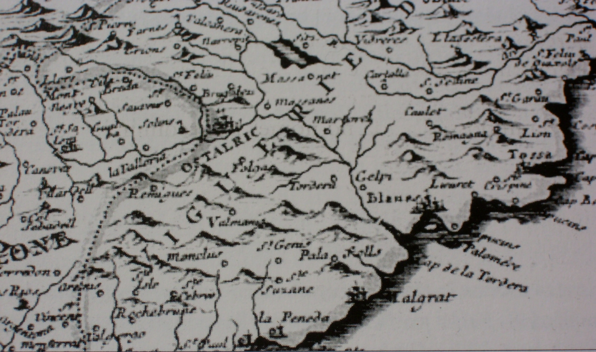
Fragment d'un mapa de Catalunya editat a París l'any 1714. (Cartoteca de Catalunya 37-5-23).