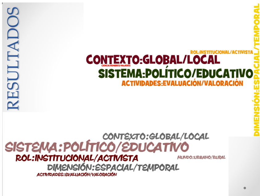
Figura 04. Representación de la frecuencia de cantidad de tensiones dialécticas de la Red SUPPORT (arriba) y la Red FormadoR-EDS (abajo)