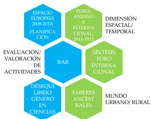
Figura 07. Conclusiones términos dialécticos SUPPORT (en color azul)/FormadoR-EDS (en color verde)

Las conclusiones sobre las tensiones dialécticas de SUPPORT y FormadoR-EDS, se simplifican en la figura 07, en color azul y verde, respectivamente.