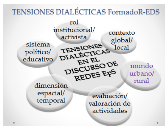
Figura 02. Tensiones Dialécticas de la Red FormadoR-EDS