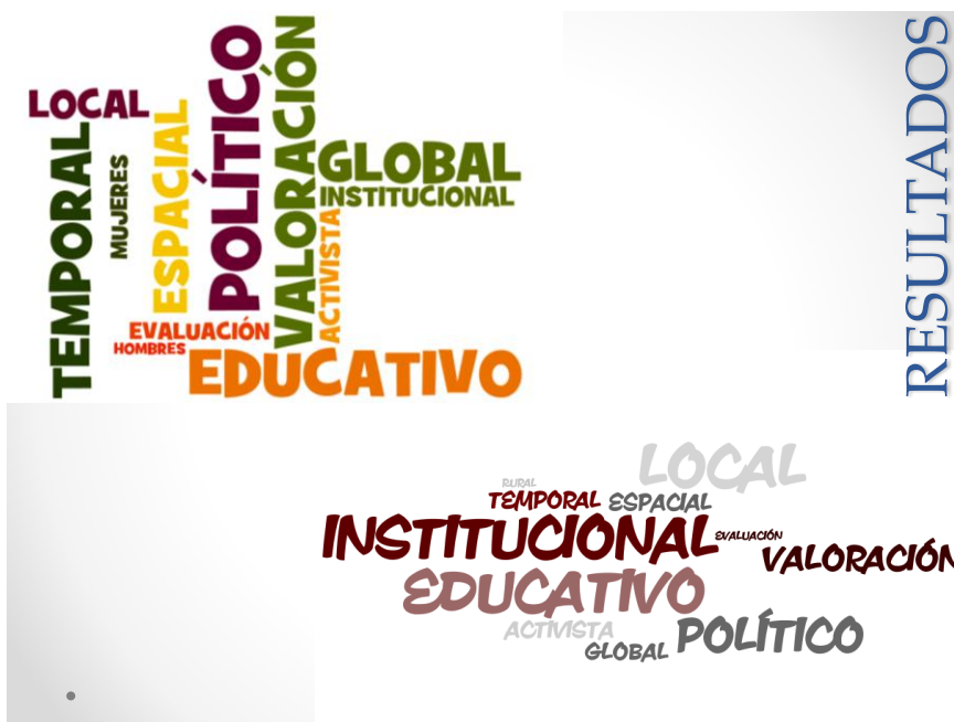
Figura 05. Representación de la frecuencia de cantidad de los términos dialécticos de cada tensión dialéctica de la Red SUPPORT (arriba) y la Red FormadoR-EDS (abajo)