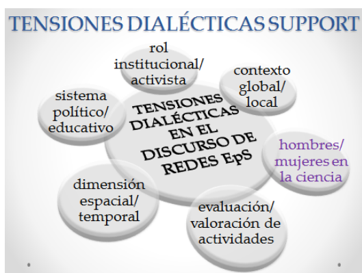
Figura 01. Tensiones Dialécticas de la Red Comenius SUPPORT