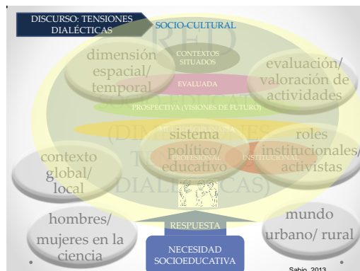
Figura 03. Tensiones Dialécticas de redes de EpS, relacionadas con sus dimensiones

En la figura 03, podemos comprobar cómo estas tensiones dialécticas se relacionan con las dimensiones definidas, anteriormente, de una red de EpS como red socioeducativa.