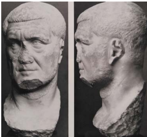
Fig. 2 Retrat de front i perfil de Maximí el Traci, cap de marbre, ca. 235-238, Carlsberg Glyptotek, Copenhagen.