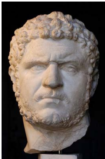
Fig. 1. Caracal·la , bust de marbre, 212-217, Musei Capitolini, Roma.

i el començament del Baix Imperi, una espècie de principi del fi. Si bé s'ha acostumat a simplificar la crisi amb un sol període que abarca tot el segle, generalment s'hi poden identificar tres fases (Bravo 1998: 497): la Monarquia militar (193-235), l'Anarquia militar (235-284) 4 i Dioclecià i la Tetrarquia (284-324). De totes elles, és durant la segona quan s'han atribuït els moments més crítics, en tant que s'estaven posant en perill les dinàmiques tradicionals que conformaven la personalitat de l'imperi i que asseguraven la seva continuïtat.