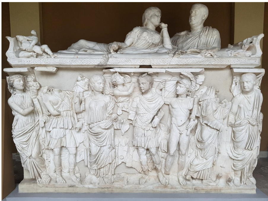
Fig. 6. Vista frontal del sarcòfag de Balbí, marbre, segon quart del segle III, provinent de les catacòmbes de Praetextatus , Museo Classico, Roma.

D'aquesta manera, si bé a nivell estilístic en els retrats acostuma a haver-hi una correspondència amb les característiques físiques i/o el perfil de cada candidat, a nivell iconogràfic, pel que es conserva, no sembla que es faci una especial distinció entre les tipologies per part de cap emperador.