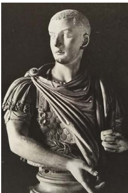
Fig. 5. Gordià III com a militar, bust de mig cos de marbre, ca. 242, Musée du Louvre, París.

Si bé la representació estilística encaixa amb cada perfil d'emperador, en la vessant iconogràfica no s'aprecia un distinció entre ells. En la mesura en què les peces conservades ho permeten, es pot observar una continuïtat en l'ús de les mateixes tipologies iconogràfiques tradicionals en la representació de l'emperador. La permanència en aquests codis visuals es dona en tots els retrats imperials de l'Anarquia militar, fossin del perfil que fossin. Alguns exemples que es conserven són els de Pupien (Fig. 3) i Felip l'Àrab, el quals destacarien pel seu rol militar (de fet Felip seria proclamat emperador per l'exèrcit). Tot i això, els trobem representats segons el tipus de toga contabulata típic de l'època. 21