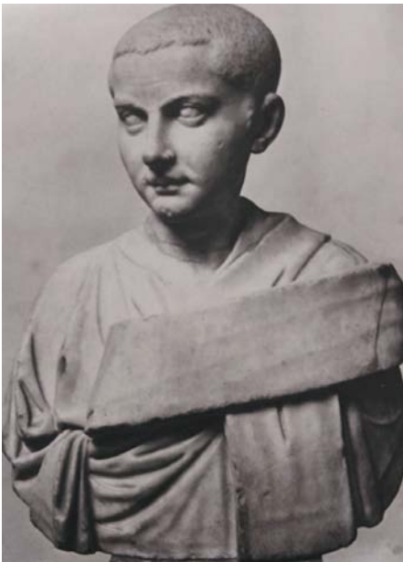
Fig. 4 Togat de Gordià III, bust de marbre, ca. 238-241, Antiken Sammlung, Staatliche Museen, Berlín.

Per altra banda, els retrats d'estil augusteu es caracteritzen per uns contorns suaus i modelats amb detall que presenten al subjecte de forma elegant i estilitzada (Wood 1986: 64). En aquests casos, la relació amb l'estil d'època augustea és molt més acurada degut a que, en contraposició al militar, es segueix molt més en la línia tradicional del model establert per August. Els seguidors d'aquesta tendència serien, per un costat, emperadors joves 20 i, per l'altre, els que volien destacar el seu rol i legitimació senatorial (Wood 1981: 85). Dins d'aquesta categoria, l'exemple més clar és el de Gordià III (Fig. 4). D'ell, bàsicament es diria que “va ser un príncep alegre, bell, amable, grat per tots (...) res li faltava per exercir el poder excepte l'edat (...) va ser estimat pel poble, pel Senat i per l'exèrcit com no ho va ser cap altre emperador” ( Hist. Aug. , 20, 31). Deixant de banda la tendència a exagerar de les fonts, la joventut de Gordià III a l'hora d'ascendir al tron imperial —només tenia 13 anys—, el seu destacable llinatge i el seu nomenament per part del Senat farien totalment lògic que se'l representés destacant aquests trets, que el relacionaven directament amb la figura tradicional de l'emperador present en dinasties passades.