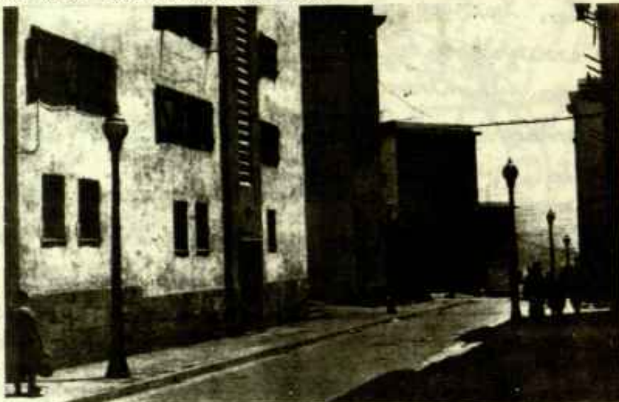
VIVIENDAS DE LA O.S.H. DE VERDUN

Se hizo una reunión con todos los vecinos afectados y se vió que el problema más grave que tenía no era este, sino el de la mala construcción de sus pisos y no sólo de ellos, sino de toda la barriada de la O.S.H. de Verdún. La humedad de los pisos acaba con los muebles, ropa, instalaciones e incluso con la salud de los vecinos. Es inútil rascar la cal hasta hacer aparecer los ladrillos y volver a pintar; al cabo de poco tiempo las manchas negras y la capa mohosa vuelve a aparecer en las habitaciones.