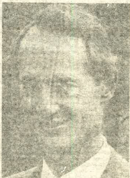
Carlos Hugo de Borbón-Parma