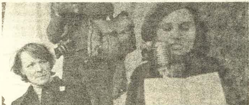
La infanta María Teresa dirige la palabra a los asistentes. Doña Irene lo haría a continuación.

¡Viva Portugal! ¡Viva los obreros de Potasasi! ¡Viva los curas encerrados! ¡Viva los perseguidos de Chile! ¡Abajo Pinochet y todas las dictaduras! ¡Autogestión. Revolución! ¡El pueblo unido, jamás será vencido! ¡Viva la reina Irene! ¡Viva Carlos Hugo! ¡Viva la monarquía socialista!