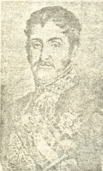
Don Carlos María Isidro, Carlos V, el primer pretendiente carlista.

«En definitiva —dijo—, la abdicación ha venido a aclarar que don Javier siempre apoyó a don Carlos Hugo, y que las maniobras reaccionarias, en contra de la línea socialista y federal que vienen aquellos manteniendo, ya no tienen nada que hacer.»