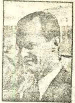
Carlos Hugo de Borbón-Parma: nuevo jefe del carlismo.