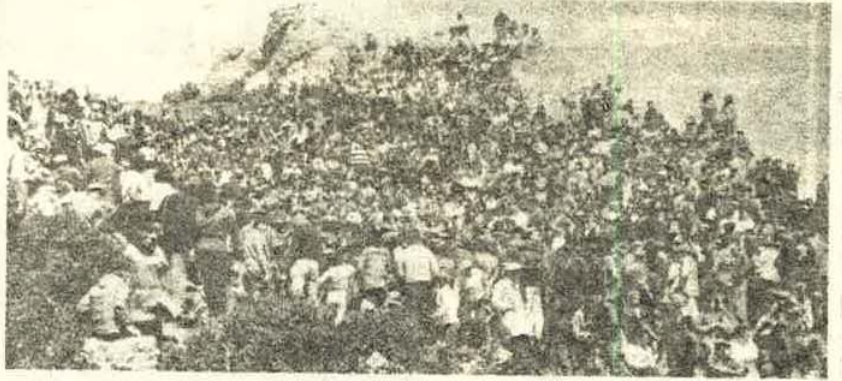
Desde media mañana los carlistas comenzaron a tomar posiciones en la cumbre de Montejurra.

Lo primero que hacemos los periodistas es proveernos de una tar-