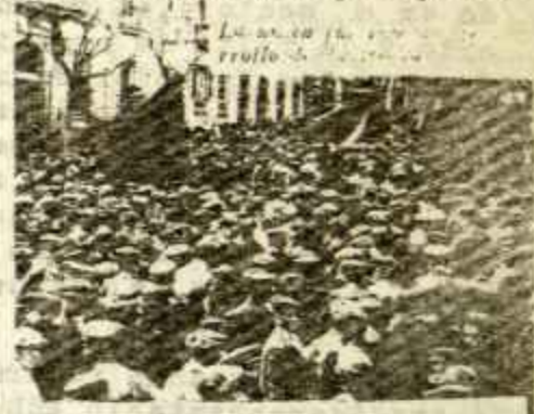
MANIFESTACION OBRERA EN MADRID. 1905

Mientras ellos continúan, llamando la atención, o intentando llamarla, a los que luchamos abiertamente por construir la teoría de la revolución en España, mien-