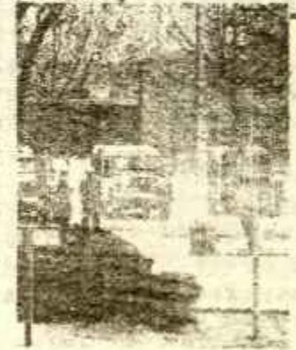
POLICIA EN LA UNIVERSIDAD

(Próximo apartado. "Y III: EL MOMENTO SUPERIOR DE LA LUCHA")