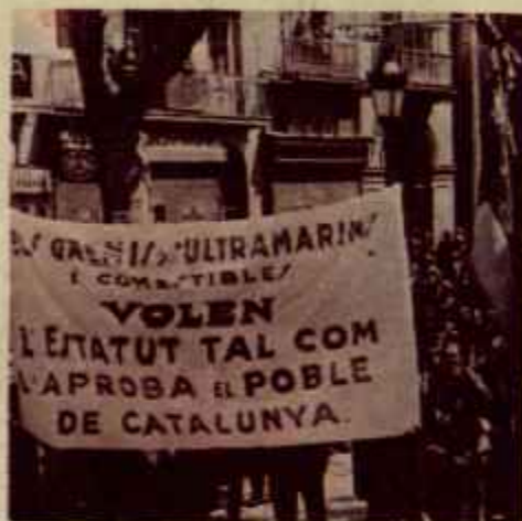
Manifestación en apoyo del Estatut de Catalunya en abril de 1932.

La burguesía republicana y sus instituciones de poder mostraron también a este nivel su ambivalencia. Por una parte, actuaron como freno para la realización plena de la autodeterminación de las nacionalidades —en este caso de Catalunya—, con lo cual una de las tareas más acuciantes de la revolución democrática en el Estado español quedaba sin resolución satisfactoria, mientras la propia burguesía evidenciaba el carácter no revolucionario de su