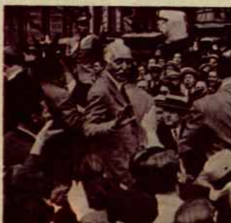
El primer presidente de la Generalitat, Macià, rodeado por la multitud. (Foto: Instituto Municipal de Historia de Barcelona).

en favor de los rabassaires, los campesinos arrendatarios catalanes. La Lliga, el partido "regionalista" de Cambó y de la gran burguesía catalana, apeló ante el Tribunal de Garantías Constitucionales de Madrid contra la ley, alegando su carácter anticonstitucional por el hecho de que el Parlamento Catalán era incompatible para legislar en materia social. El Tribunal derogó la Ley, que fue nuevamente votada y aprobada por el Parlamento Catalán. Se planteaba así un problema de jurisdicciones, cuyo telón de fondo no era otro que el de la autonomía mal resuelta. Y al mismo tiempo se ponía de relieve el carácter de clase del "nacionalismo" de la burguesía catalana.