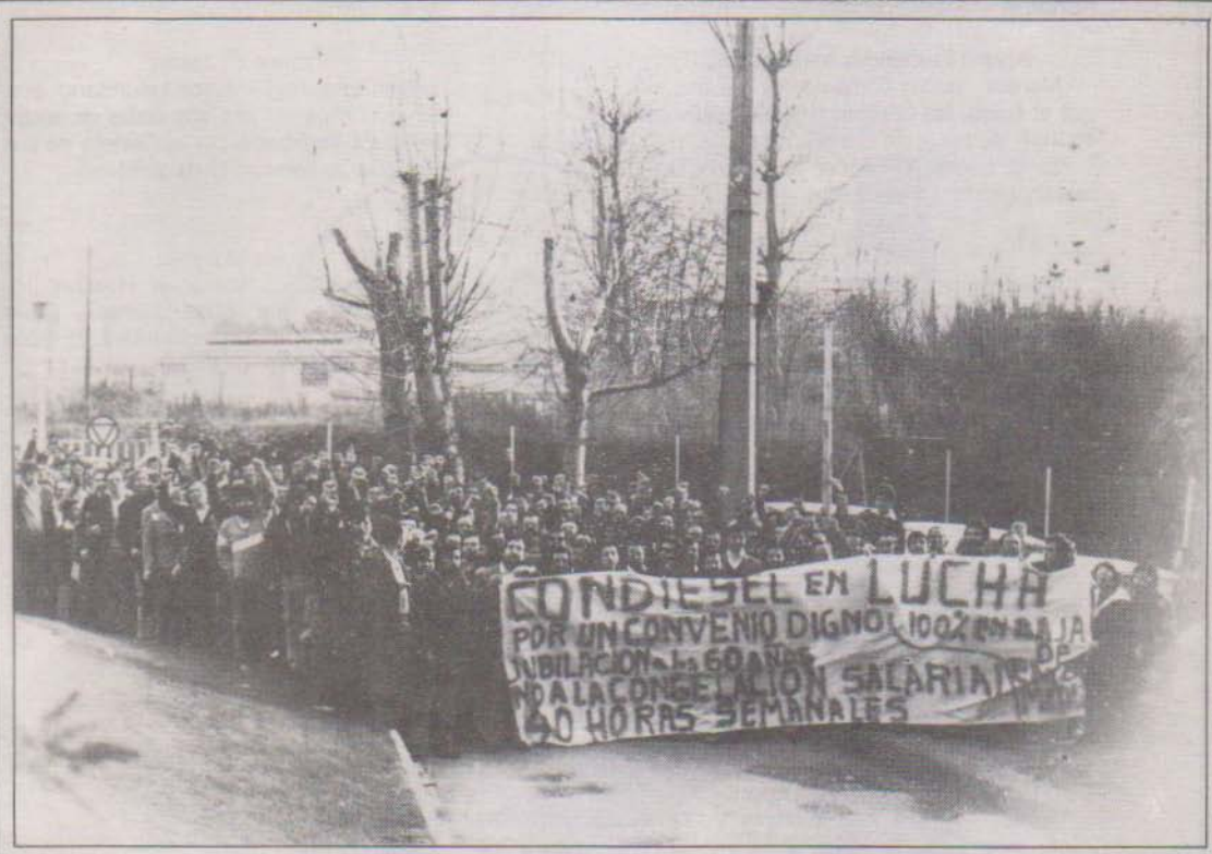
LOS TRABAJADORES DE CONDIESEL, EN CONTRA DE LOS TOPES SALARIALES, EN CONTRA DEL PACTO SOCIAL Y EN APOYO DE NUESTRO CONVENIO.