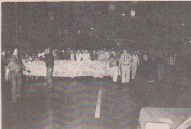
LA LLUVIA NO PUDO CON LA MANIFESTACION

El señor Bertolin estaba muy dolido con nosotros porque en el número anterior le habíamos llamado 'dictador'. No se ponga así, hombre. Aunque pudiera ser cierto que no lo fuera tanto y que los trabajadores que hay en su sección fueran gatitos domados, algunos de ellos, con buen escondite. Porque el día 27 (el día de la huelga) hubo uno que le pidió permiso para salir a la calle, perdón rectificamos, lo que le pidió fueron excusas y mil perdones por tener que salir aunque fuese obligado.