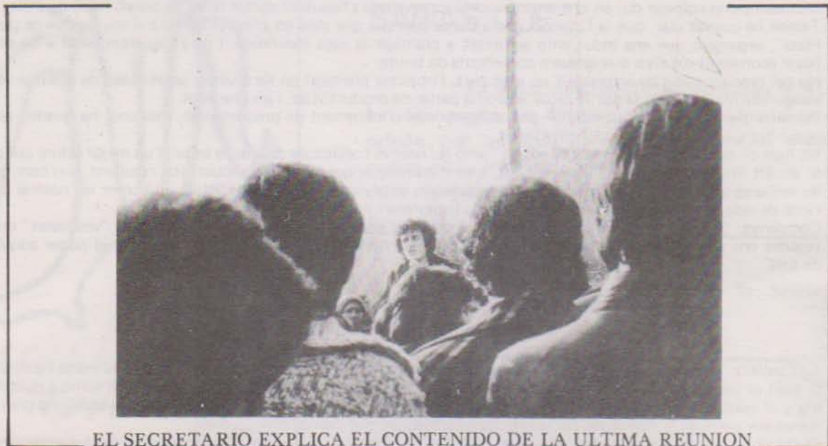
EL SECRETARIO EXPLICA EL CONTENIDO DE LA ULTIMA REUNION

Queremos que quede bien sentado que a la hora de elegir a los encuestados, no hemos tenido en cuenta ni su ideología política ni su puesto de trabajo, aunque hemos de resaltar que algunos compañeros debido a su puesto de trabajo no nos permitían poner su nombre al lado de sus declaraciones, de ahí que nos hayamos visto obligados a no reflejarlas.