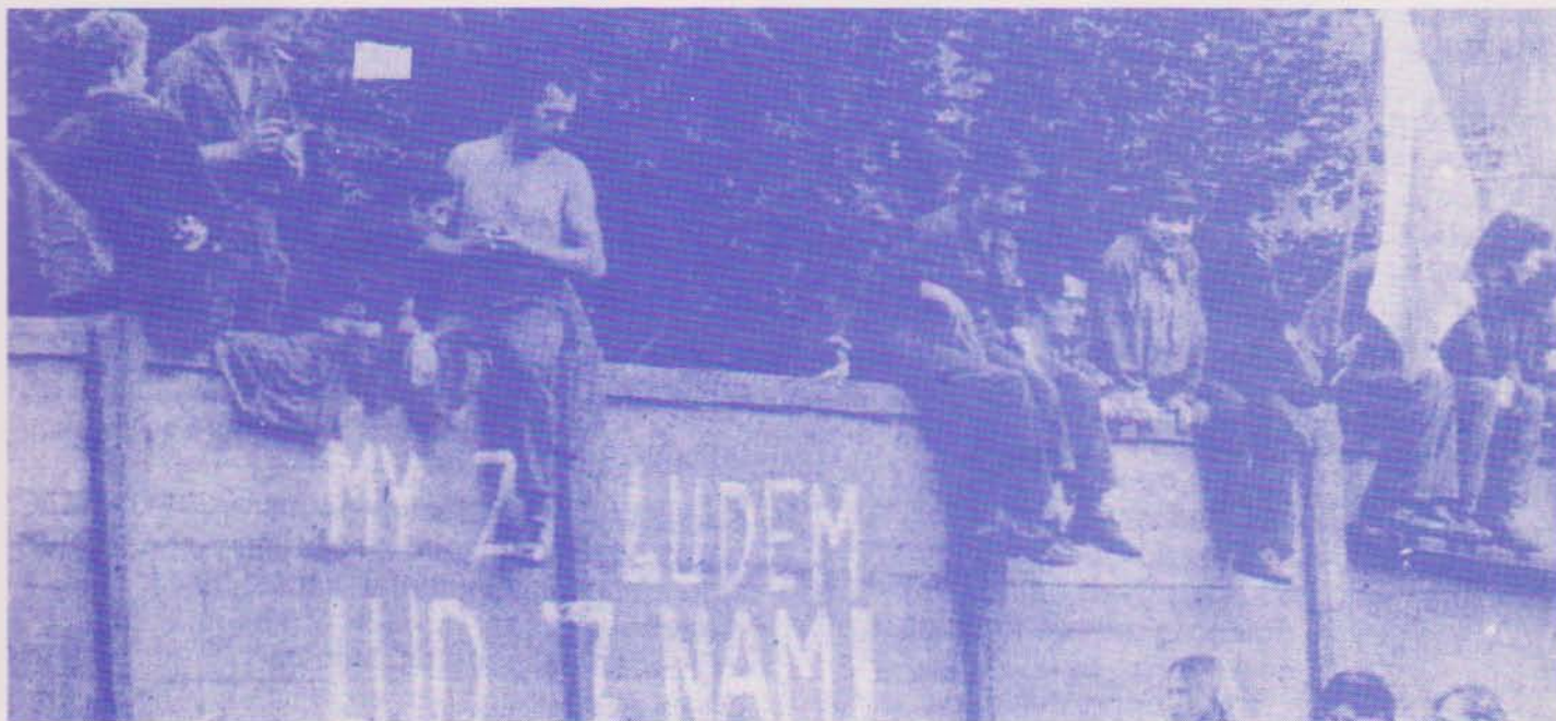
La huelga en un país socialista, novedad positiva.

Otra situación ha sido el conflicto de Polonia. Hoy, treinta de Agosto, parece que se ha llegado a una solución. De los veintiún puntos de la tabla reivindicativa, han conseguido dieciocho.