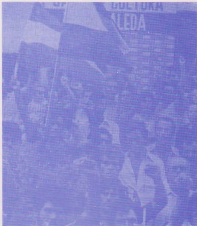
El pueblo unido en su lucha bajo la bandera

El papel de la Iglesia: El Papa, según las noticias recibidas aquí, tiene gran prestigio entre sus compatriotas (¿?) No obstante, los trabajadores han denunciado al Cardenal Primado cuando dijo que era mejor negociar que hacer huelga. No se puede estar entre dos aguas y eso que la "nave de San Pedro" está acostumbrada a ello, por eso lleva casi dos mil años de existencia. El cristianismo supone compromiso con los obreros y no alneación con el más fuerte.