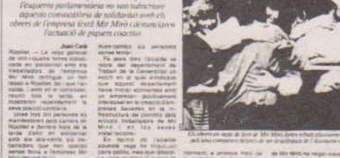
El piquet general de Ripollet amb Mir Miró, amb el suport de l'ajuntament i les centrals sindicals.

La vaga general parilitza ahir completament Ripollet durant el dia d'ahir. L'ajuntament, les centrals sindicals i magistrats i els punts de l'Esquerra parlamentària no van intervenir en cap moment amb els obrers de l'empresa Mir Miró a conseqüència d'una vaga general convocada