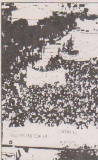
La huelga general fue considerada legal y la manifestación tolerada.

Se pudieron observar un total de 20 pancartas, todas ellas pertenecientes a fuerzas políticas extraparlamentarias, y la