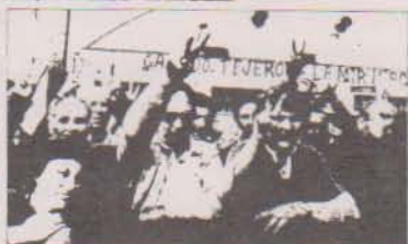
Una de las manifestaciones por los partidos parlamentarios, el Ayuntamiento de Ripollet y los sindicatos CC-OO y UGT. El Ayuntamiento, los sindicatos CC-OO y UGT, si bien firman un comunicado conjunto en la lucha de los trabajadores de Mir-Miró en la defensa de sus puestos de trabajo, pero desautorizan esta huelga general convocada con carácter colectivo, por no ser el medio idóneo para solucionar el problema.

de carácter colectivo, por no ser el medio idóneo para solucionar el problema. Finalmente, los partidos políticos, sindicatos, firmantes del documento se comprometieron conjuntamente a «ejercer todas las soluciones de seguimiento necesarias para el buen término de las negociaciones de Mir-Miró S.A.». Al respecto, se ha nombrado una comisión