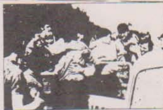
Los trabajadores de la empresa "Mir-Miró" a la huelga a las 7.30 horas.