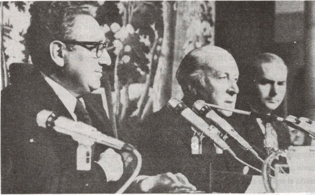
José M a de Areilza, junto a Henry Kissinger en la rueda de prensa que hizo públicos los acuerdos hispano-yanquis de 1976. Se ratificaba la dependencia española, intentando limar de paso los aspectos más escandalosos de las relaciones con los Estados Unidos.