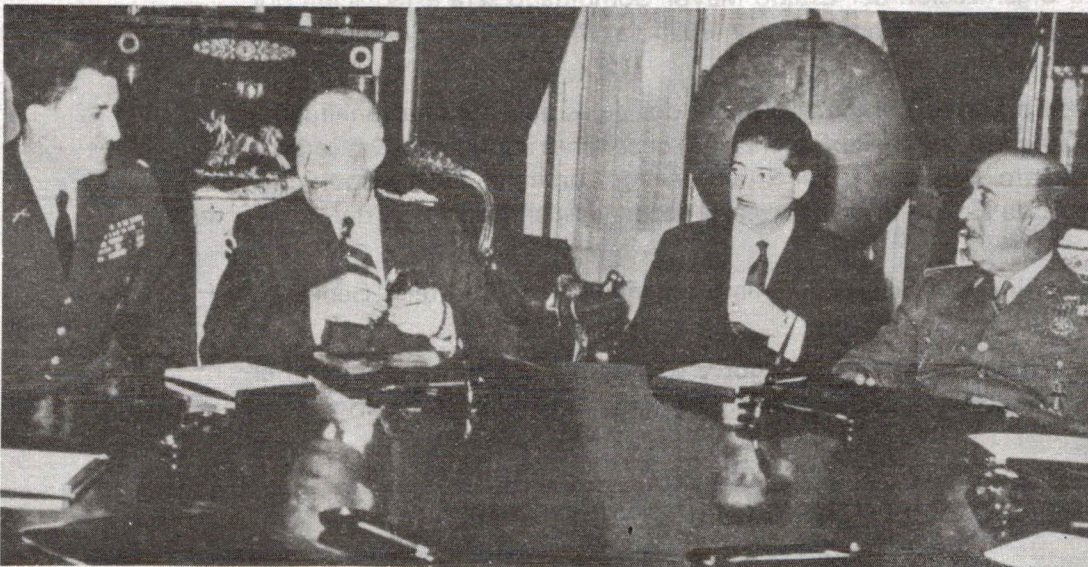
El presidente norteamericano Eisenhower y su intérprete y subdirector posterior de la CIA Vernon Walters, junto con Pinies y Franco en el Pardo. La llegada de Eisenhower ratificaría el alcance de los acuerdos de 1953 y significó un importante respaldo al régimen fascista.