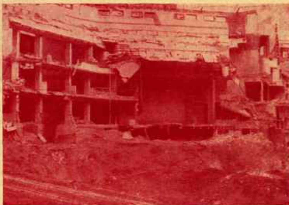
El Price en l'actualitat

abans de la guerra aquella sala esplèndida per la seva estructura arquitectònica, va servir per reunions polítiques i actes populars de tota mena, després del 39 es convertí en el mirall d'una societat infantilitzada, esportizada i religiosament dirigida. Aquí no em cal demanar a ningú informacions. El Price es troba en la meua geografia personal com potsar cap altre entitat de Barcelona. Allí els anys quaranta, anava jo a veure el circ; a la sortida ens regalaven una trompeta i un barret de paper. No era gaire més el que les escoltes i la societat donaven aleshores als nens, com si no fossin altra cosa que maniquís sense cervell per a pensar i múscles per actuar. Al final d'aquella mateixa dècada, a la Setmana Santa, el Padre Laburu, trencava els timpans dels fidels amb la seva oratoria tan sagrada com reaccionària; reconsagrada que deia el meu avi. I no el sentien només els que es trobaven a l'interior de la sala. Els altaveus turmentaven tot el veïnat, tot el barri de Sant Antoni, del Pedró, de Tailers. La cara dels mítings s'havia convertit en la creu del P. Laburu. Però, cal dir-ho, aquells sermons demostraven les possibilitats de vida popular del local, encara que allí no s'hi anés a parlar, només a escoltar.