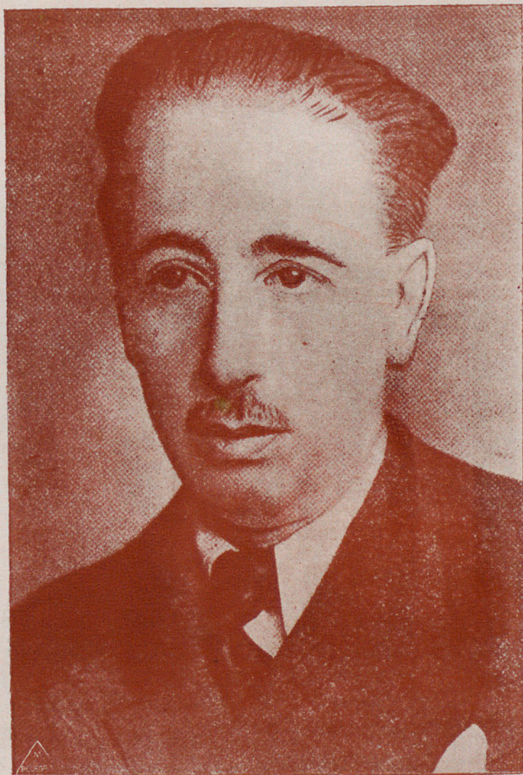
LLUIS COMPANYS I JOVER Segon President de Catalunya 15 d'Octubre del 1940.