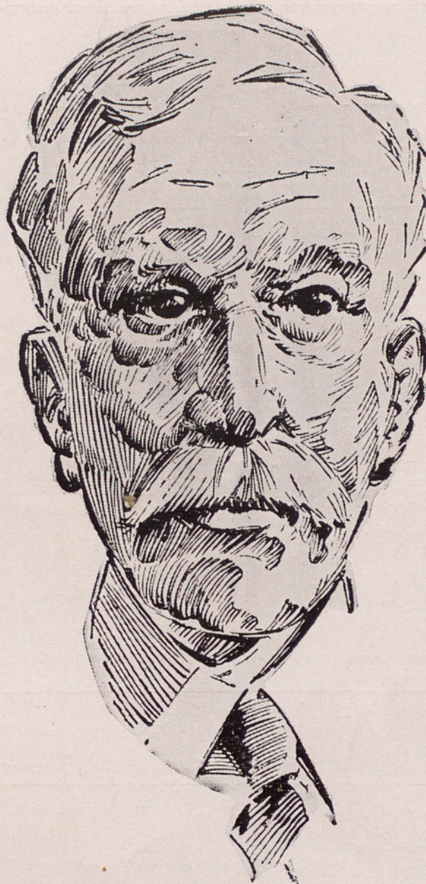
FRANCESC MACIA I LLUSSA