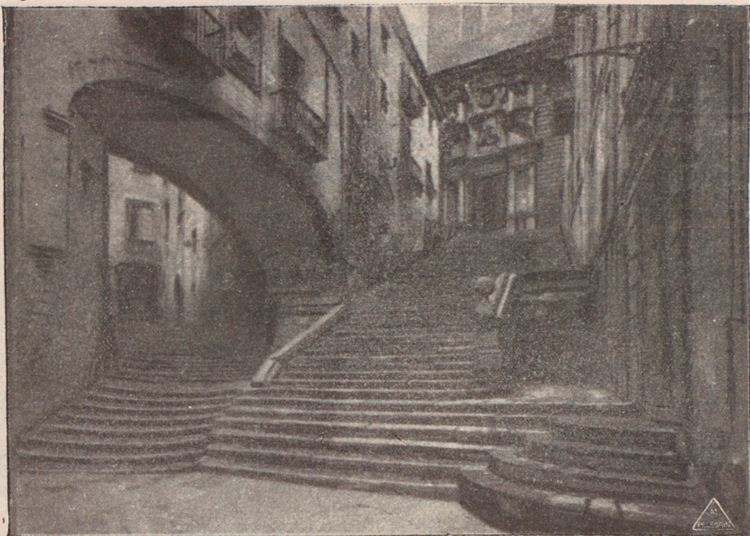
DE LA GIRONA VELLA. — EL PALAU DEL VESCOMPTAT.