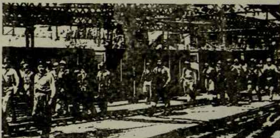
La clase obrera debe extender y afianzar sus Comisiones

ciones de vida y de trabajo, y cuál es la política que conduce a su liberación como explotada y oprimida.