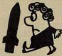
tenece al terreno de la hipótesis bélica.

Estas políticas de socialdemócratas y eurocomunistas muestran la importancia de las iniciativas propias del movimiento antiguo. Desde hace algunos meses se desarrolla un referéndum "autogestionado", que ha obtenido ya un éxito innegable. Lanzado a nivel local y regional, tiene el objetivo de recoger cinco millones de firmas contra la instalación de la base de Comiso — como de cualquier otra base del mismo tipo en cualquier lugar de Italia — y por la convocatoria de un referéndum oficial a escala estatal. □