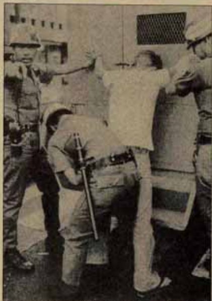
La crisis del régimen está abierta. Sin embargo, los grupos de oposición no parecen capaces de emprender la lucha directa por el poder.

Probablemente esa era la razón por la que fue asesinado antes de poder intervenir en las luchas políticas por la sucesión de Marcos. La muerte de Aquino significa la desaparición de la mejor carta — quizás la única, pues será difícil sustituirla — que le quedaba por jugar a Washington, y las fracciones inte-