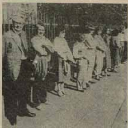
Empleados de la fracción parlamentaria del SPD alemán delante del Parlamento Federal en Bonn, a las 11:55 del pasado cinco de octubre. El primero por la izquierda es Hans-Jochen Vogel, presidente de la fracción del SPD.

La Comisión anti-OTAN de Madrid denunció en el último número de su revista Zona Cero la paranoia de los gastos militares "socialistas" en un país en el que existen 2.218.000 personas paradas según la Encuesta de Población Activa del INE. 1.708.000 parados que no cobran ningún salario de desempleo, 300.000 jubilados que subsisten con las 24.000 pesetas mensuales de un empleo comunitario que llega tarde, mal o nunca; planes de reconversión industrial que destinarán 80.000 pesetas de trabajo e inducción a la pérdida de unos 200.000. Es de suponer que nuestro movimiento obrero tiene algo que decir sobre esta contradicción brutal entre "calentós y mantenido". Mal rollo si nuestro movimiento quiere comportar, por ejemplo, la opinión del