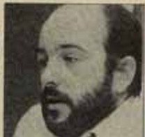
randilla de la Concha" por su amor a la Bella Esas.

¡Eh, eh, con el franquismo el futbol era ocio para el pueblo. Con la democracia los futboleros han pasado de opiniones a gilipolleas □