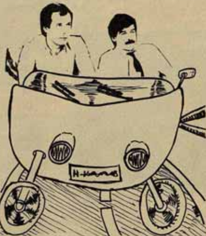
La teoría del sidocar o cómo enganchar al PCE a la moto del PSOE. Así lo ve nuestro dibujante (IV).

resulta difícil al documento encontrar álgico temas de desmarque técnico con el PSOE: una ley electoral proporcional; la retención de la LOAPA y una política de rápidas transferencias; la desmilitarización de la Policía y de la Guardia Civil; la legislación del aborto; la oposición a la LRU y al proyecto de LODE; etc. Pero se advierte fácilmente la falacia de este supuesto política de izquierda, al leer que habrá que esperar a la maravillosa fase de la Democracia Política y Social para que culmine el desarrollo pleno del Estado de las Autonomías. Por otra parte, las "audacias" en el terreno de la desmilitarización de la policía tienen por objetivo correr las condiciones para que se pueda ver al policía como un trabajador que pertenece al conjunto de los asalariados. Y, como ha concluido la transición, el problema del gobierno puede desahucarse en una sola línea: «la plena democratización de los aparatos de Estado». Lo cual, naturalmente, irá acompañado de una modificación profunda de la enseñanza militar, que, por lo que se lee, incluye al suficiente