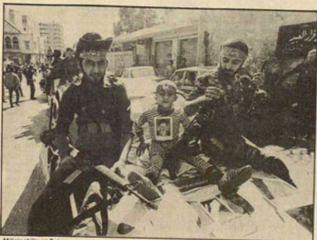
Milicia chilita en Beirut.

Esto otorga una mayor responsabilidad a las fuerzas políticas revolucionarias del Líbano, de los demás países árabes y de los países imperialistas occidentales. Los imperialistas y sus aliados pueden ser derrotados de forma decisiva en el conflicto libanés. Y esta derrota contribuirá mucho a debilitar la ofensiva imperialista contra la revolución colonial en general. En este sentido, la oposición activa a la ocupación imperialista y sionista del Líbano será un factor crucial. □