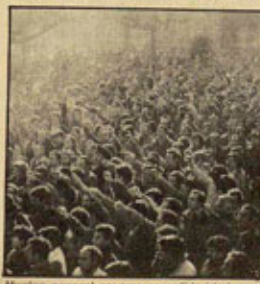
Huelga general navarra en solidaridad con Potestas.

Las respuestas tienen que ser consecuentes, y lo están siendo. Aceriales ha dado un nuevo impulso a la movilización.