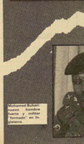
Mohamed Buhari: nuevo hombre fuerte y militar "formado" en Inglaterra.