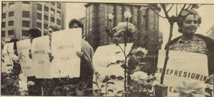
Las Madres de Euzkadi, todos los martes en Bilbao.