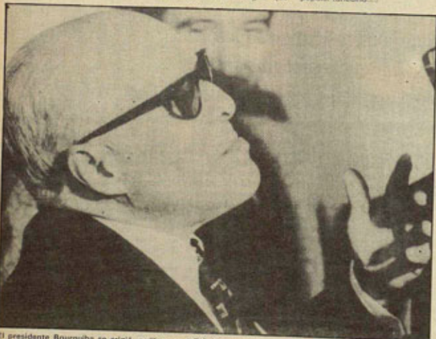
El presidente Bourguiba se erigió en "bonaparte" de la situación. 26 marzo 1984/8

En Bizkaia enseñantes de STEE-EITAS y de CCOO hemos tomado las riendas de este trabajo colectivo como experiencia piloto. En el transcurso del año escolar os seguiremos informando de la marcha de este proyecto y animando a otros sectores laborales, sindicales, organizaciones culturales y de todo tipo a acercar lazos con sus colegas nicaragüenses. □