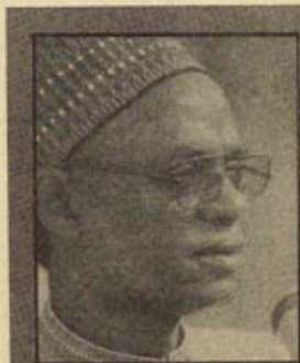
Shehu Shagari: los militares le dieron el poder en 1979 y se lo quitaron en 1984

El ejército era el único sustituto posible de un aparato de Estado capaz de aplicar las exigencias del FMI. Pero aunque las masas nigerianas apenas manifesten descontento alguno por el fin de un régimen corrupto, su pasividad no está garantizada frente a la degradación previsible de sus condiciones de vida.