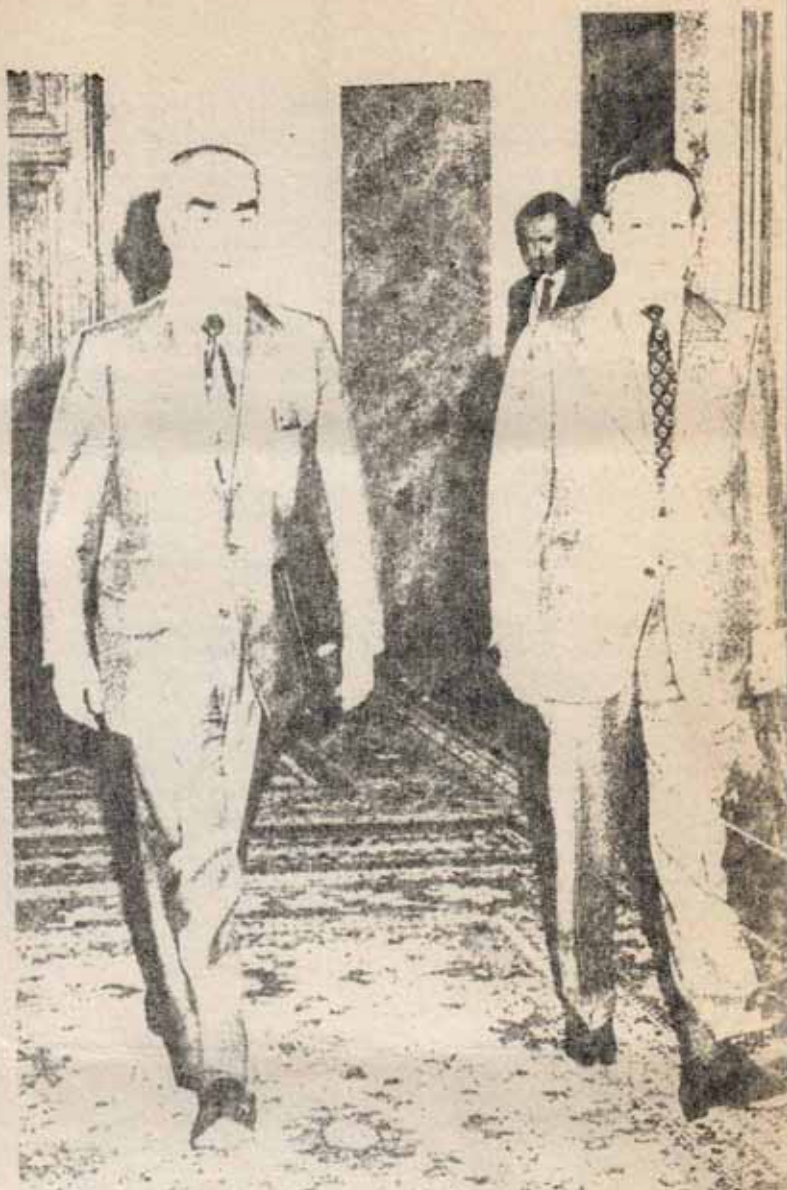
Carrero Blanco y Fernández Miranda Hacia la institucionalización del Régimen

Paso a paso, el Gobierno Carrero emprendió la realización de tales planes escalonados cautelosamente, temerosamente. A lo limpio verano de activistas en las empresas y de trabajadores de la enseñanza -prolongada hasta hoy- siguió una ofensiva a fondo con todas las armas contra el movimiento estudiantil, intentado segar las bases de su relanzamiento antes de que la lucha obrera adquiriese suficiente cuerpo como para enlazar en un mismo combate. A lo vez, iba aplazando el juicio 1.001 precisamente para no dar pie a tal conjunción. De septiembre o noviembre, el Gobierno tiene que enfrentar una potente oleada de movilizaciones obreras, amenazadora a pesar del