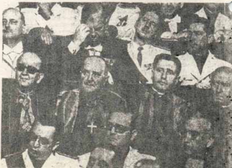
Obispos en las Cortes

...y los obispos no quieren ser menos... "condenar el "crimen" y ensalzar al fervoroso cristiano que acababa de comulgar".