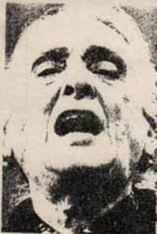
DOLORES IBARRURI, LA PASIONARIA.

Con la mayor franqueza, la dirección del PCE = plantea a la burguesía que no le obligue a hacer = la revolución. Pero no hay que alarmarse; cuando la dirección del PCE habla de la lucha por "la victoria de la libertad y el socialismo", no dice nada distinto a la vía seguida por la Unidad Popular de Chile.