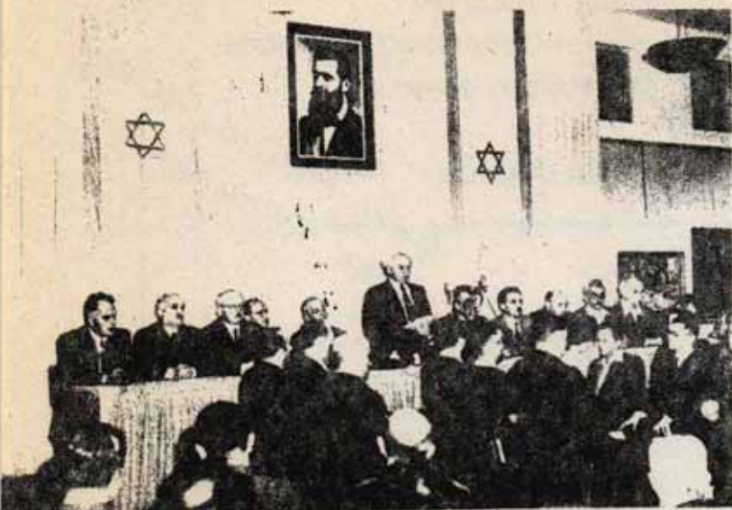
Momento histórico, 14 de mayo de 1.948. David Ben Gurion lee la Declaración de Independencia del Estado de Israel. Sobre él, la fotografía de Teodoro Herzl, fundador de la doctrina sionista.

tras haber oído a los indios, los israelíes necesitan un subproletariado palestino. En agosto, el partido gobernante en Israel (laborista) establecía una plataforma para las anexiones que significaba la anexión pura y simple de los territorios conquistados en 1.967. Lo cual a su vez significaba que no se devolverían estos territorios, que se aumentaría la colonización judía de los mismos, y que se absorbería a los habitantes árabes. En realidad, ya actualmente 50.000 trabajadores árabes de estos territorios van diariamente a trabajar al antiguo territorio de Israel.