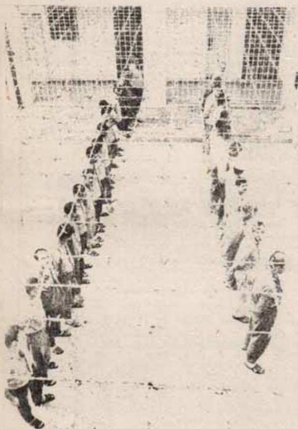
Prisión de Kafar Youa a 40 Km. de Tel-Aviv, donde son encerrados los presos políticos, tanto árabes como israelitas.

Toda la política de "coexistencia", presente en esos "altos el fuego", acuerdos y resoluciones, pretende "estabilizar" zonas conflictivas. Pero la lucha de clases, la lucha de los pueblos coloniales contra el imperialismo, las exigencias ineluctables de mantenimiento y reforzamiento de bastiones coloniales como Israel y de la dominación imperialista sobre los Estados árabes, todo esto no hay quien lo estabilice. Los imperialistas saben que las causas profundas siguen en pie. Lo que pretenden es maniobrar para ir minando y aplastando la lucha del proletariado y las masas oprimidas árabes; los dirigentes vendidos engañan a sus pueblos con promesas de "paz" a cambio de someterse al imperialismo, pero las constantes agresiones del imperialismo y sus lacayos no pueden dejar de llevar a las masas a la lucha una y otra vez. Y esta vez la victoria moral de los ejércitos egipcios será un estimulante suplementario.