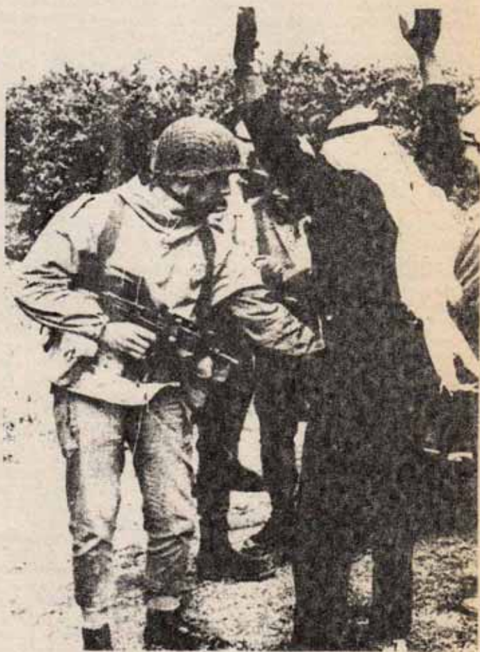
"A partir de la guerra de 1.967, el nacionalismo nasseriano entra en crisis, de forma desigual, en todos los países árabes. Se multiplican las presiones de los sectores más pro-imperialistas, por una parte, y, por otra, la presión de las masas." En la foto, un árabe es registrado por un control militar en Gaza.

El papel de la reacción terrateniente ha sido cada vez más claro. Sólo ha cambiado el padrino, que hoy son los Estados Unidos. El aplastamiento de la resistencia palestina y de amplias masas jordanas por el rey Hussein, los jefes beduinos y la burguesía jordana, mediante un Ejército financiado y formado por los imperialistas fue, en 1.970, un hecho decisivo en favor de Israel, que sostiene incondicionalmente a ese criminal de guerra. Un funcionario USA afirmaba: "Nos interesaba mantener una Jordania fuerte. Y también le interesa a Israel. Antes, Israel se asustaba al ver que ayudábamos a Hussein. Ahora piensan que todavía le ayudamos demasiado poco. Es asombroso ver la cooperación que se ha desarrollado entre Amman y Jerusalén".