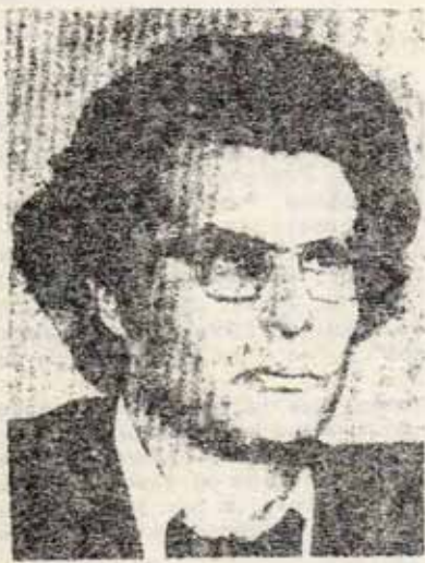
Alain Krivine, dirigente de la LIGUE COMMUNISTE

que pretendiese reconstruir la Ligue con otra apariencia sería arrestado inmediatamente. Esa es la intención del gobierno.