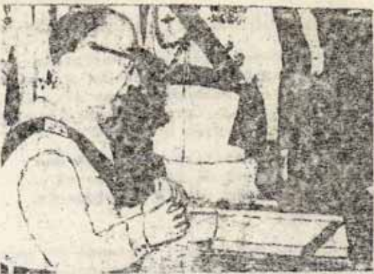
Carrero juró el cargo.

Carrero continuó la agravación de la crisis del franquismo.