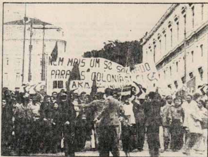
Manifestación de trabajadores africanos inmigrados

ción de los fines de los capitalistas(...) la confianza en los capitalistas", Lenin planteaba la "ruptura con los capitalistas, la desconfianza hacia ellos, el poner freno a su vil codicia y terminar con sus ganancias... la confianza en las clases oprimidas y, sobre todo, en los obreros de todos los países".