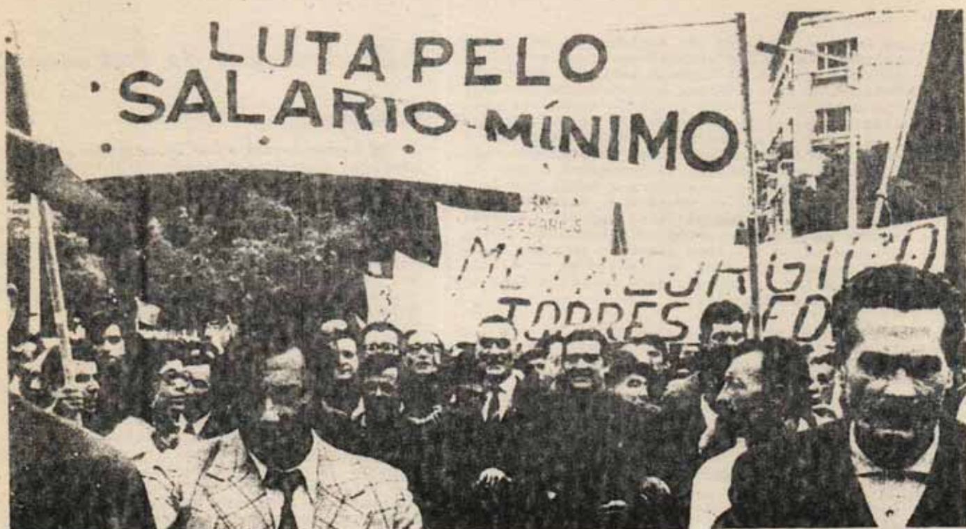
Manifestación del 1º de Mayo en Lisboa

tas de un sindicalismo respetuoso de sus normas: « subordinado al Estado burgués. Sin embargo, aunque no se contrapongan conscientemente al orden de los capitalistas que ahora representa Spínola, los pasos en la movilización independiente y la autoorganización son importantes. La puesta en pie de sindicatos como esa Intersindical que agrupa a más de 1.000.000 de trabajadores, el recurso generalizado a la huelga, la confraternización de la tropa con el proletariado y el pueblo, la solidaridad a flor de piel entre los más diversos sectores oprimidos tienen ya un carácter de clase inaceptable para la Junta. Esta aparenta dirigir lo que no controla y pronto empieza a hablar de manifestaciones de « caos y anarquía » reconociendo que las masas se están haciendo peligrosamente de su « orden ». En particular, la oleada huelguística marca una clara división, y las huelgas de hambre y enfrentamientos entre tropa y oficiales inquietan a la burguesía. « Con la primera huelga a escala nacional -superando la dispersión de los primeros momentos- que es la de Correos y Comunicaciones, las ilusiones ingenuas empiezan a henderse: la Junta da orden al Ejército de estar dispuesto a intervenir contra los trabajadores.