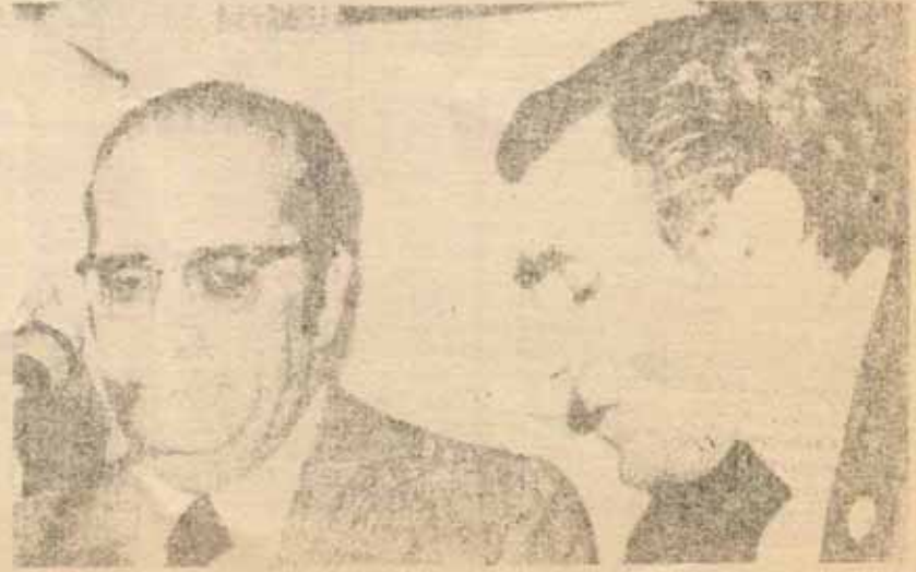
El presidente Costa Gomes y el "premier" Pinheiro de Acedo.