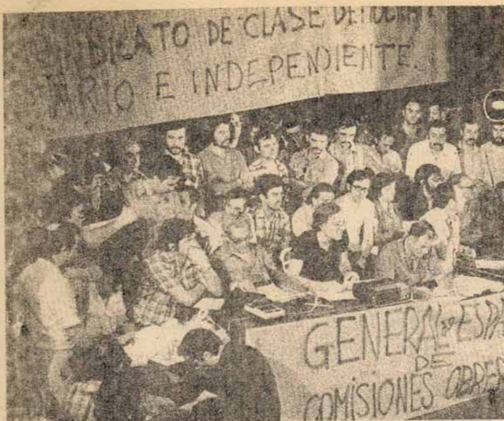
ASAMBLEA GENERAL DE ESPAÑA DE CCOO