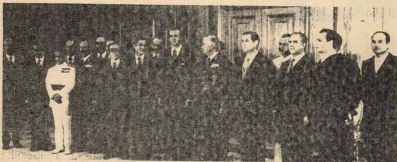
EL REY CON SU PRIMER GOBIERNO

Publicamos una síntesis, hecha por el comité de redacción, de la Resolución política aprobada por el III Congreso.