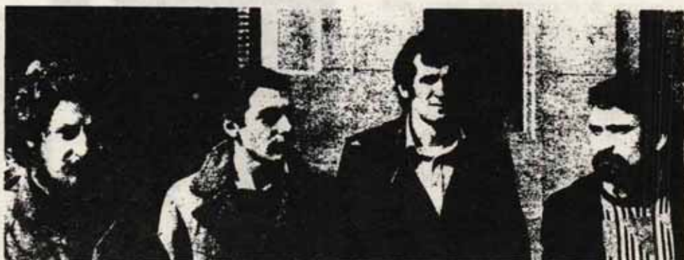
Representantes de la Liga Comunista abandonan el Ministerio de la Gobernación después de haber presentado la documentación correspondiente para su legalización.

Si este gobierno es antidemocrático, no se puede negociar con él la libertad. Desde hace más de dos