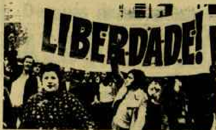
PRIMERO DE MAYO EN LISBOA

neficios quieren cargar crisis "SU CRISIS "