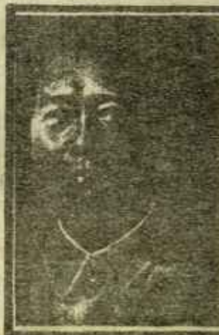
MURIO EL CAMARADA MAO TSE TUNG

Las diferencias con el gobierno anterior son tácticas: amnistía parcial, diálogo con la oposición..., pero se reducen a nada porque los crímenes se suceden como el de Javier Verdeja y Jesús María Zabala en Funterrabia; las agresiones de policía continúan reprimiendo a los trabajadores (manifestación de la Unión Naval el día 7, ataque a los albañiles en La manifestación de los campesinos el día en Valencia) prohibiendo actos populares con signos nacionalistas e republicanos lo único que permiten es, de vez en cuando, para cubrir las apariencias, algunas manifestaciones legales que sólo si se desbordadas pierden su carácter pacífico.