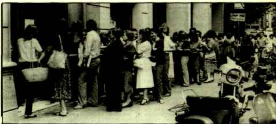
Cinc mil matriculats han fet cua aquests dies.

Un altre aspecte important d'aquesta Escola d'Estiu ha de ser el Tema General. Tots tres temes tractats específicament, però amb un comú denominador: la millora de l'escola des del punt de vista pedagògic i estructural: "La renovació pedagògica a partir dels Programes", "El futur de l'ensenyament mitjà al Batxillerat" i "Formació Professional". Totes aquestes reflexions del Tema General les farem arribar a la Generalitat.