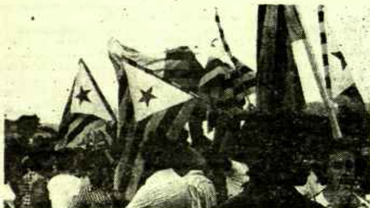
Campañas pro autogovern y pro Estatut