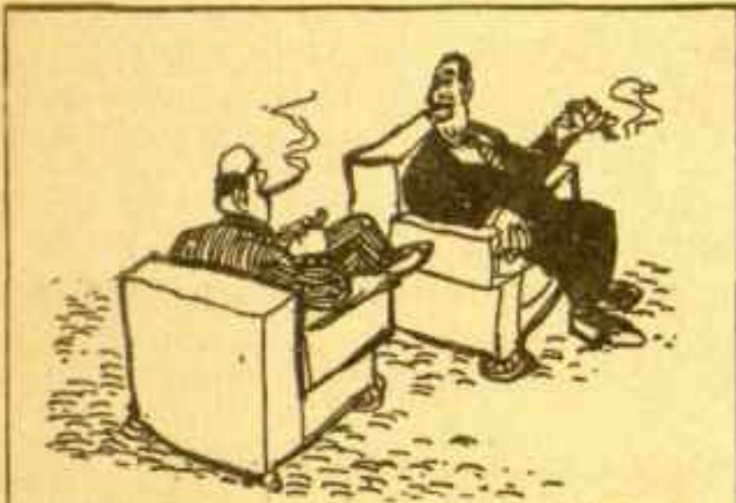
- Ya era hora de que cambiasen las leyes tributarias. No era justo eso de que los capitalistas pagásemos más impuestos que los obreros.

cepcional de Navarra y Vitoria debida a los "fueros", pero que ante las presiones locales dejará para estas provincias las cosas como estaban. La Ley creadora de un Tribunal de Orden Público tiende a dar satisfacción, una comoda satisfacción, desde luego, a ciertas presiones internacionales respecto a "la forma" como se realiza la represión en España: se trata simplemente de guardar los "modales" europeos. Y la Ley de Seguridad Social, destinada a aumentar el poder económico de las Mutualidades al suprimirles la competencia de las Compañías de Seguros privadas; esta Ley, que se está lanzando a bombos y platillo como una formidable conquista de los trabajadores frente al capitalismo, quedará sin efecto real benéfico ya que de hecho las mutualidades no están dirigidas por los trabajadores, sino por funcionarios y