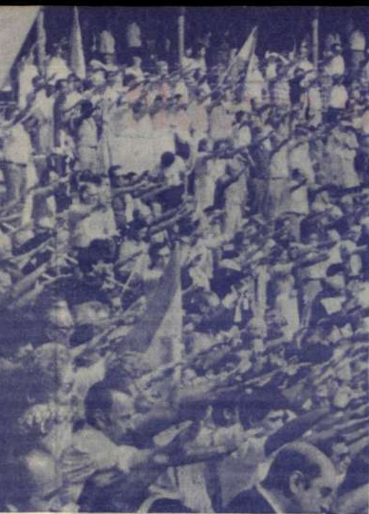
Hasta en el casco de los barcos había pegados carteles anunciadores de los actos. A la izquierda, vista parcial de la Plaza de Toros, con más de diez mil personas.