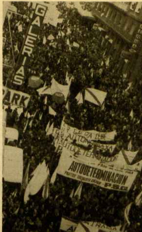
(Na fotografía, panorámica da manifestación do 4 de nadal en Vigo. Unhas 300.000 persoas —máis que o censo da cidade— con pancartas e bandeiras fan presente, outravolta, a vontade popular de diferenciación política de Galicia: un relevante elemento dinámico constitutivo da nación galega).

E, se cadra, igual non estaría de máis que o anotasen desmemoriados e escépticos.