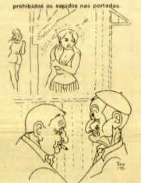
— XA TI VES PRA QUEN FIXERON A DEMOCRACIA SAIR, SAIR EN PORRANCHO, PRO SÓO PODEN VELAS OS QUE TEÑEN CARTOS PRA REVISTA. — E ASÍ FAN CON TODO.

E isto requiriría sentar as bases políticas que permitisen a creación dos organismos de planificación económica. E dicir, a existencia dun poder galego.