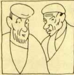
O primeiro emigrante é rache galego e chamábase Colón (1924)-Cebreiro en El Pueblo Gallego