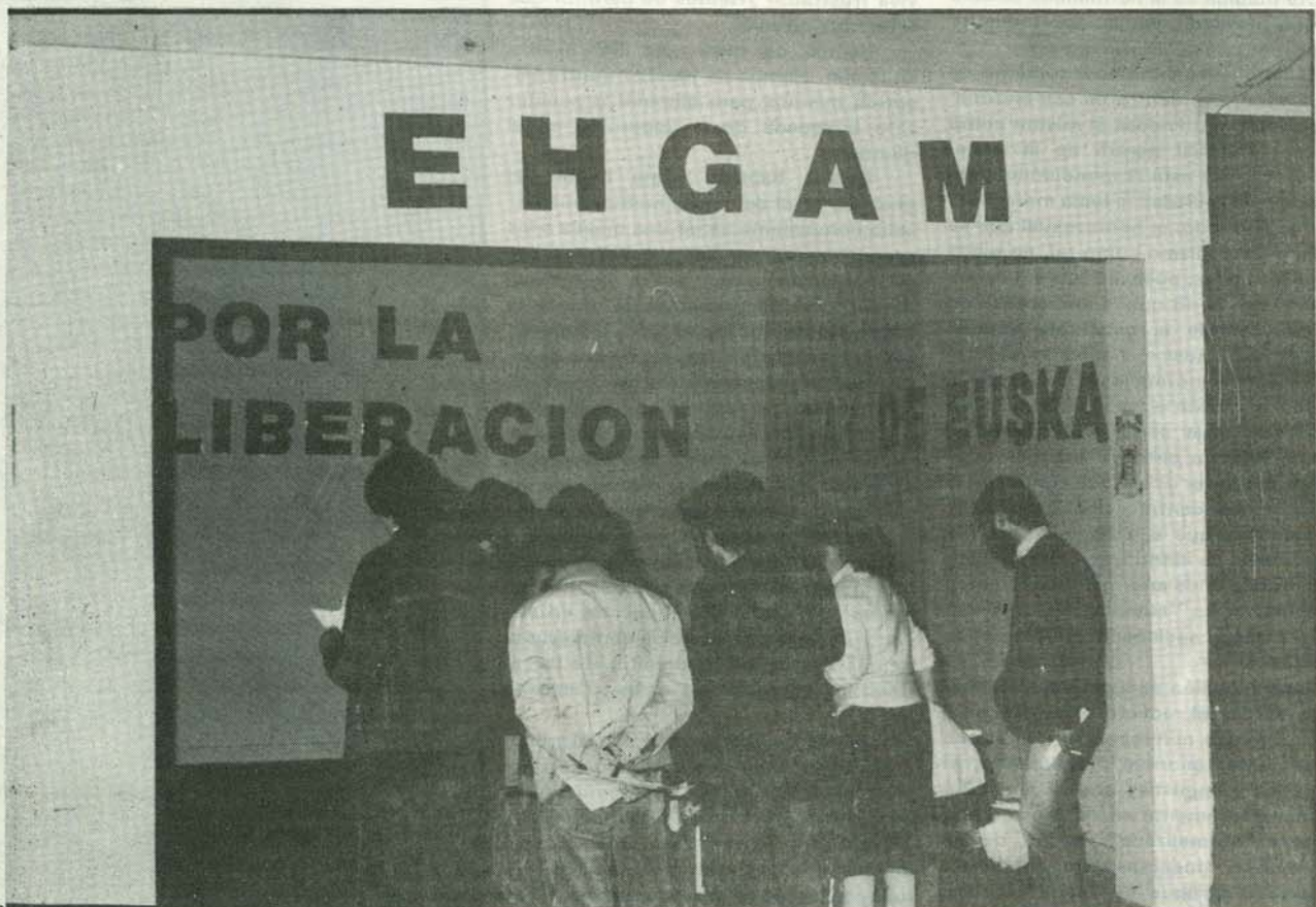
Stand de EHGAM en la TXARRI-BODA de EUZKADIKO EZKERRA.