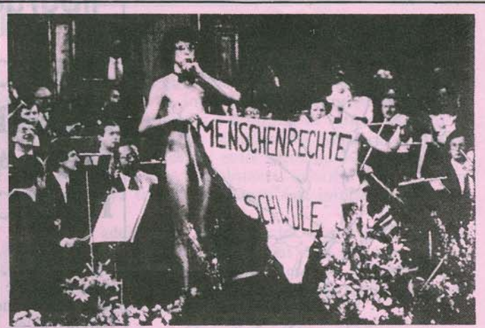
PROTESTA BEREZIA VIENAN

Una noticia ya un poco pasada, pero que en nuestra opinión es, además de simpática, demasiado poco conocida: