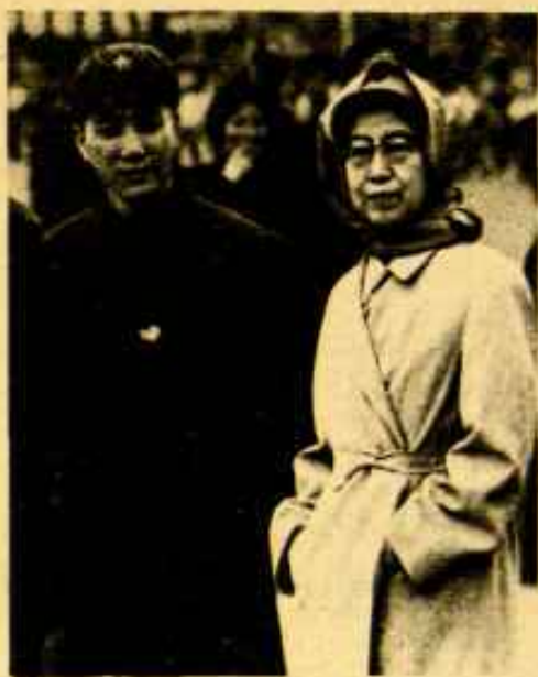
Wang Hung Wen et Chiang Ching

Pero, a pesar de que los "radicales" se batían en retirada, estos continuaron siendo el punto de apoyo político fundamental del mismo Mao. Al mismo tiempo, conservaban una base en algunas secciones del Partido (particularmente en Shanghai), en la prensa y en la milicia urbana, todo lo cual debía servir de contrapeso frente a los militares conservadores. Después de 1969, la primera prueba de fuerza importante se produjo durante el X Congreso, celebrado en agosto de 1973. Fue aquí donde los "radicales" lanzaron, inesperadamente, las campañas "contra la corriente" y "contra Confucio", con el objeto de reforzar su posición en la batalla por la dirección. Las dos fracciones parecían salir del X Congreso en igualdad de fuerzas. Pero teniendo en cuenta que los "moderados" habían vuelto a ocupar los mismos puestos que antes del levantamiento de 1966, eran estos quienes se encontraban en mejores condiciones para la consolidación de su poder.