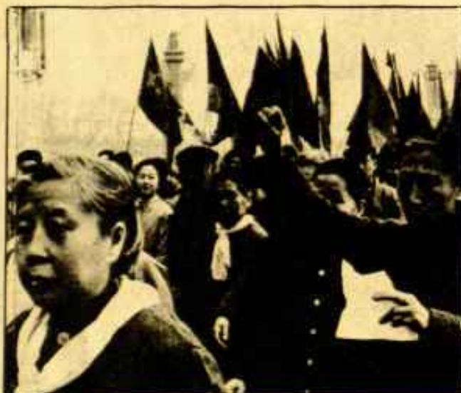
Manifestación en Tien-An-Men

Como hemos señalado en el artículo anterior, otra característica decisiva del último periodo es que, al tiempo que las tensiones sociales dramáticamente expresadas por la RC, se continúan exacerbando, las masas tienden cada vez menos a orientarse hacia una de las fracciones de la burocracia en la búsqueda de soluciones, apoyándose más y más en sus acciones propias e independientes. Esto se ha podido comprobar, entre otros ejemplos, por la oleada de huelgas desencadenada en Hangchow en 1975, y en la actitud de los Guardias Rojos, primero movilizados y después reprimidos por los líderes "radicales", que, junto con un gran número de jóvenes sin empleo de las ciudades y de los pueblos, se hallan ahora dispuestos a luchar contra el grupo de Mao-Chiang Ching. El surgimiento de poderosas corrientes revolucionarias clandestinas en la juventud china se ha