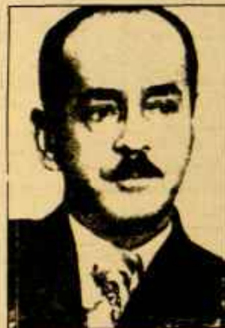
El Presidente Hugo Banzer

Esta fábrica de calzados es subsidiaria del consorcio inglés que opera en América Latina con la denominación genérica de "BATA". Se instaló en Bolivia hace 35 años, expandiendo sus operaciones continuamente a costa de la quiebra de otras fábricas pequeñas (Plus Ultra, Zamora, Tardío, etc.) Durante el gobierno del MNR, la Mónaco se introdujo en las minas nacionalizadas, beneficiada con una especie de monopolio. Pero además de copar el mercado interno, esta empresa se especializó en fabricar calzado fino para la exportación, especialmente a Europa, aprovechando el bajo precio de la materia prima y los reducidos salarios que paga.