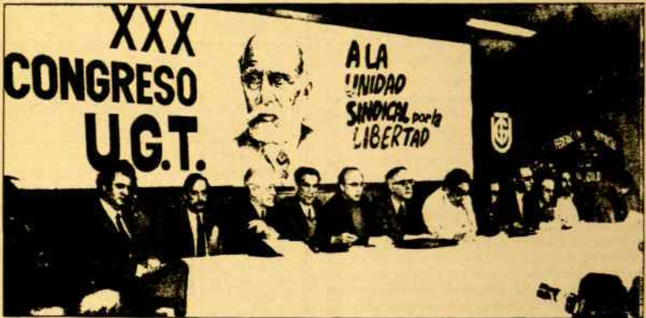
La Comisión Ejecutiva saliente.