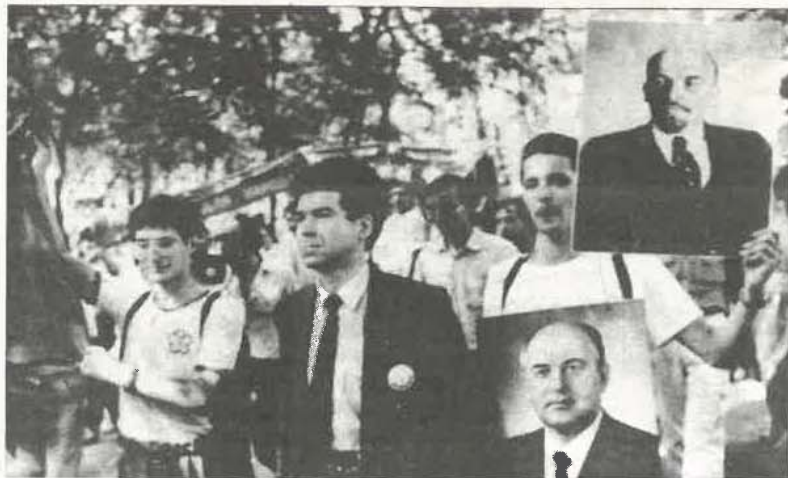
Manifestación de apoyo a la perestroika en Moscú.

Es un libro notable y debe estar disponible junto con otros escritos sobre la revolución: Plejanov, Sujarov, Lenin, Martov y otros. Todos estos deben ser leídos y evaluados. Existen historias hechas por los que propusieron y fueron arquitectos de la revolución, y también de sus opositores. Hay historias que defienden la Revolución de octubre, y Trotsky se ubica entre estos. Martov y Sujarov están en una categoría ligeramente diferente. Y por otro lado están los rotundos opositores de Octubre, como Kerensky y Milyukov. Todas estas