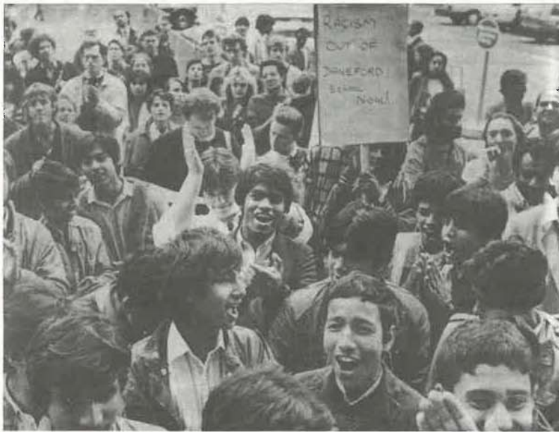
Manifestacion antirracista en Londres.

expresión en Occidente, sino también y sobre todo una campaña por las libertades democráticas en los países que no las tienen, hasta el punto de que sus gobiernos pretenden incluso limitarlas en el extranjero. Los Rushdie que habitan en esos países deben también poderse expresar libremente, porque mientras una parte de la humanidad permanezca encadenada, ninguna libertad estará definitivamente conquistada. La defensa de Salman Rushdie no es la de los "valores occidentales" contra la "cultura oriental", sino la de los derechos de todos, incluso los orientales, a la libertad de expresión.