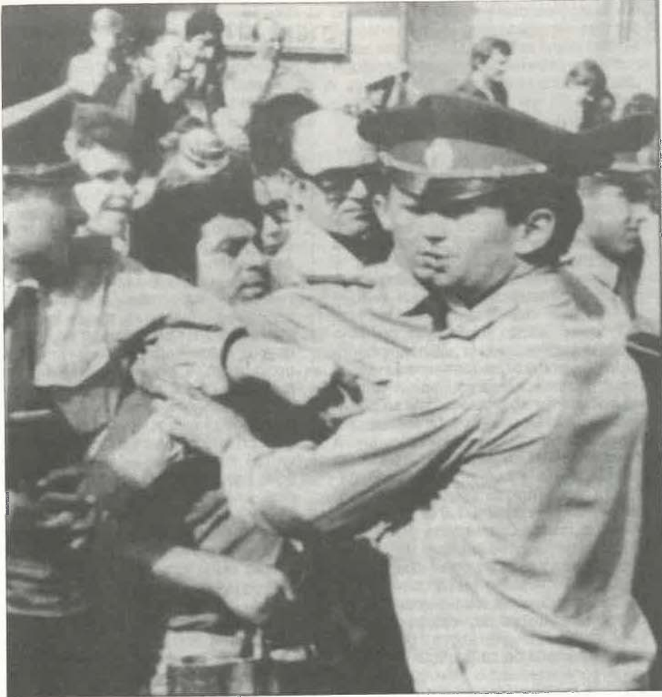
Policías acordonando una manifestación en la plaza Pushkin de Moscú.

lización en profundidad de las masas soviéticas: sólo primicias en la clase obrera, ya realidad en la intelligentsia y en ciertas nacionalidades. Sea cual sea el desenlace a corto plazo de las luchas en la Unión Soviética, se ha creado una situación nueva que excluye el retorno al statu quo anterior.