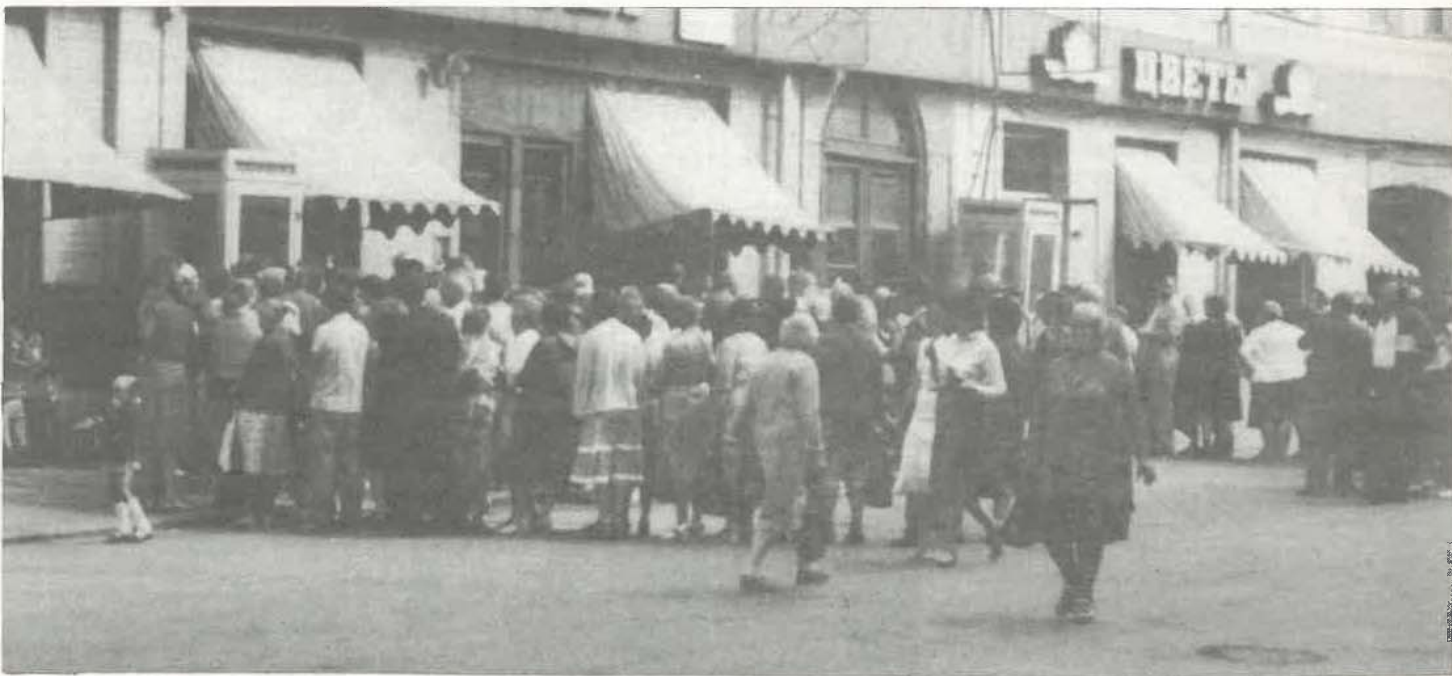
Cola ante una tienda de alimentación en Moscú.

La necesidad de sindicatos que defiendan a los trabajadores se pondrá de candente actualidad con la aplicación de la reforma. Las consignas oficiales de democratización de las organizaciones