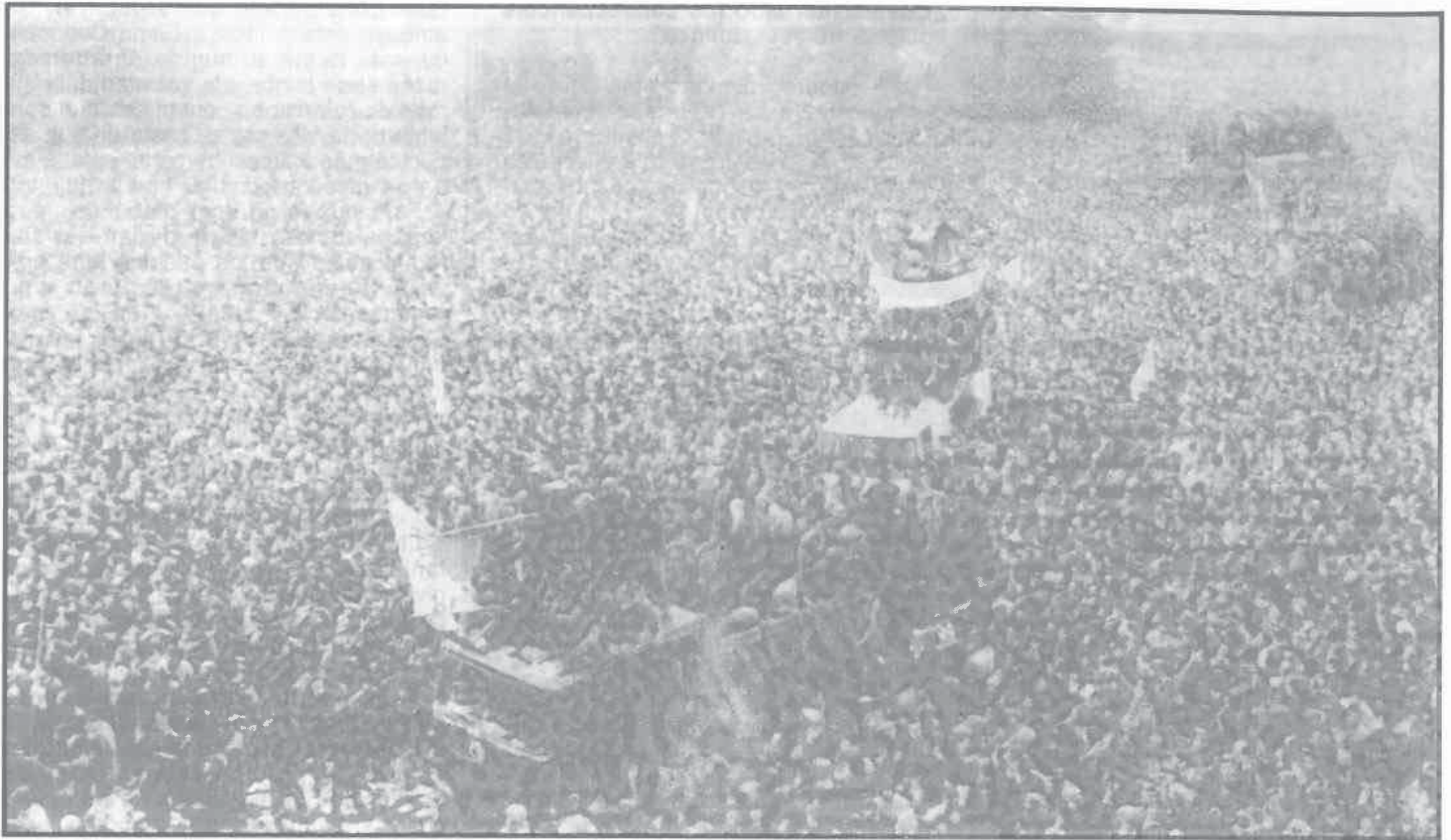
Celebrando multitudinariamente la victoria sobre Ceaucescu

El único cambio habido fue la apertura a los créditos occidentales, pero de una forma muy instrumentalista, destinando esos créditos en beneficio de una estrategia económica nunca modificada: prioridad a la industria pesada, desarrollo de los sectores sobredimensionados, como la química, la petroquímica, el acero y la siderurgia, en detrimento total del consumo y del desarrollo de la agricultura. El lema de "el 70% para la inversión y el 30% para el consumo" no se modificó en ningún momento, mientras que en otros países del Este fue cambiando progresivamente. A partir de mediados de los años 70, la economía comenzó a estancarse, para iniciar después un serio retroceso. A partir de principios de los 80, con el reembolso de la deuda, la parte de la renta nacional destinada al consumo se redujo más aún, mientras que en el terreno de las inversiones, al despilfarro en vigor hasta entonces sucedió una progresiva congelación que se ha mostrado desastrosa para la maquinaria industrial.