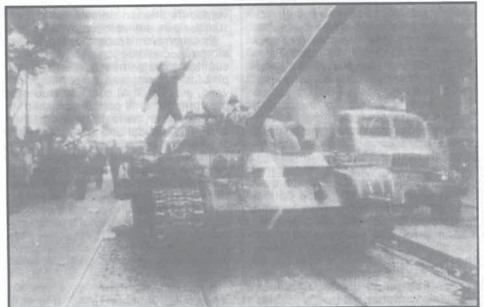
1968: tanques rusos en Praga

Las grandes luchas comenzarán durante la campaña de las legislativas. Pero creo que hay un peligro antes para el Foro: repetir el proceso electoral polaco, es decir, presentar un sólo candidato del Foro en cada circunscripción; en este caso, ningún otro candidato de la oposición tendría posibilidades. Dadas las circunstancias, esto era una necesidad en Polonia, pero nada nos