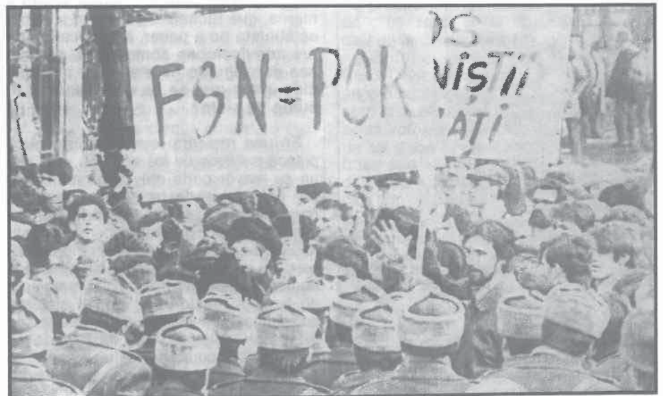
Primeras protestas contra la Junta de Salvación Nacional

12-1-90. (entrevista realizada por Janette Habel y Erdal Tan)