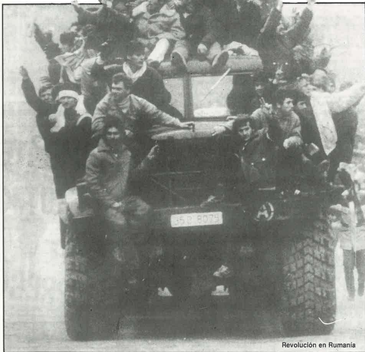
Revolución en Rumanía

RUMANIA. El derrocamiento de la dictadura ( E.Lhomei ). URSS. Los sindicatos soviéticos ( D. Seppo ). BRASIL. El PT, un nuevo tipo de partido. ( M.Lowy ). TEMA. Luchas nacionales y perestroika ( C.Verla, J.Koshiw, M.Sokolov, G.Foley ).