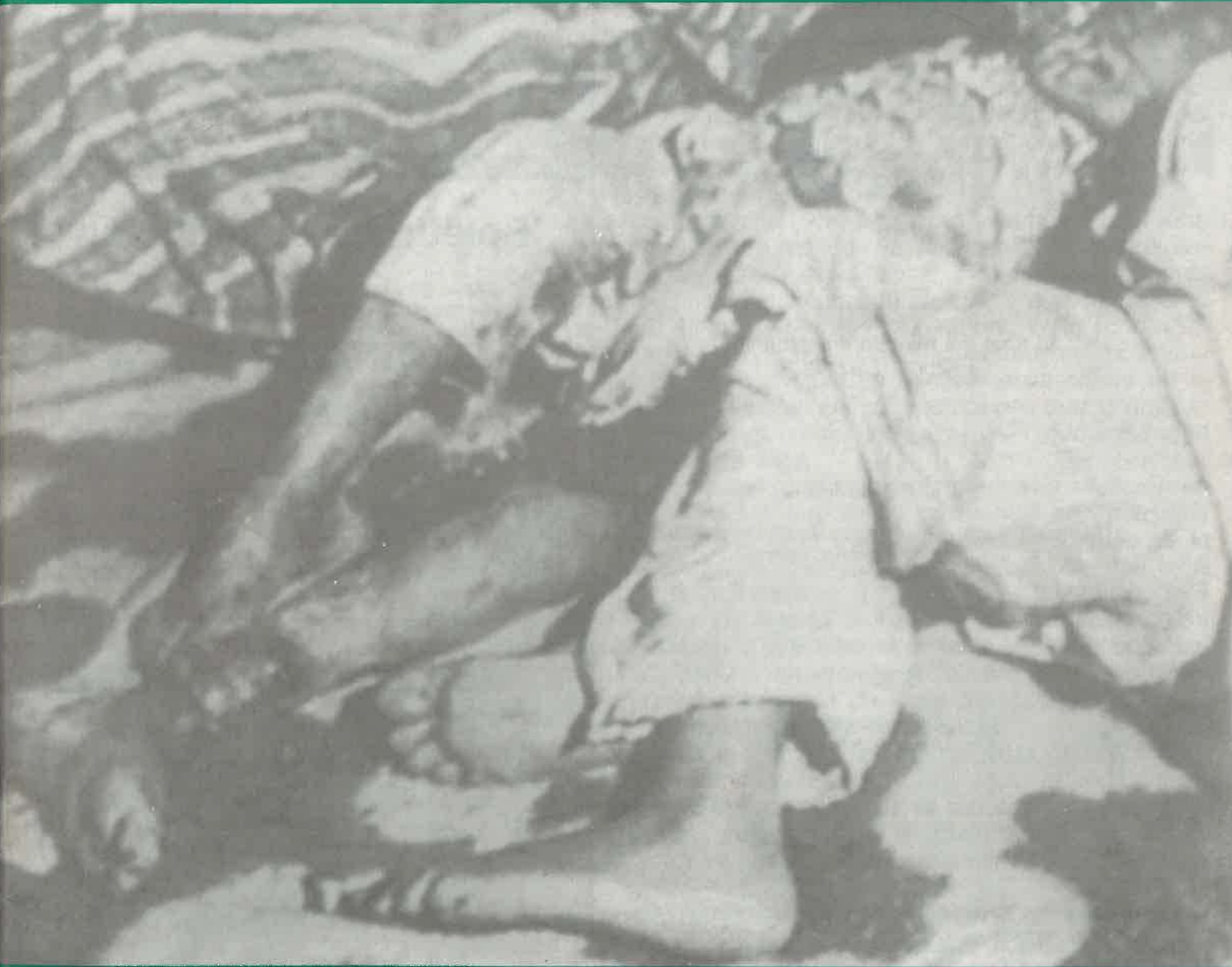
Operación Tormenta del Desierto: masacre del pueblo iraquí