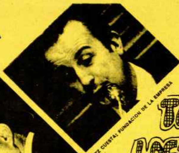
FERNANDEZ CUESTA: FUNDACIÓN DE LA EMPRESA