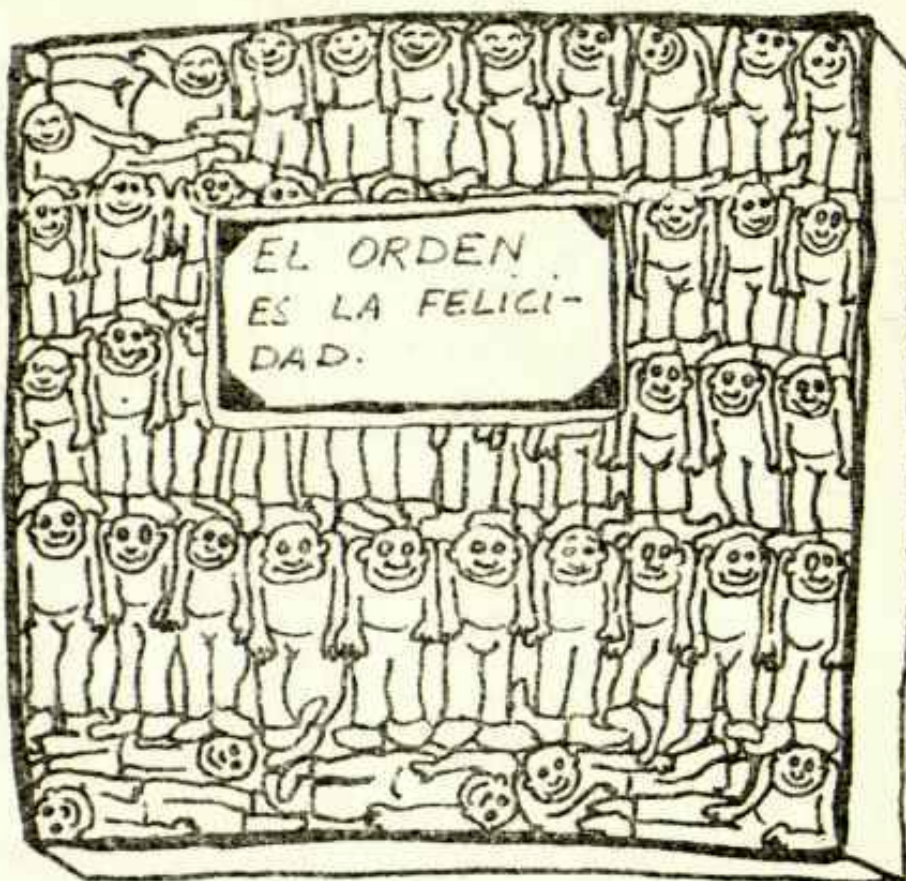
El sueño que los patronos navarros han contado a Carrero Blanco

Todo esto, absolutamente incomprensible para quien cree o quiere vivir en un estado de derecho, bajo el imperio de la Ley aceptando sus obligaciones y viendo respetados sus derechos, no tiene más que una explicación. Y es siempre la misma. Se toleran ilegalidades queriendo evitar con ello conflictos de orden público, y se apoya la actuación del elemento obrero, sacrificando en todo lo que sea preciso los derechos del empresario, porque caso no se tome una actuación de fuerza.