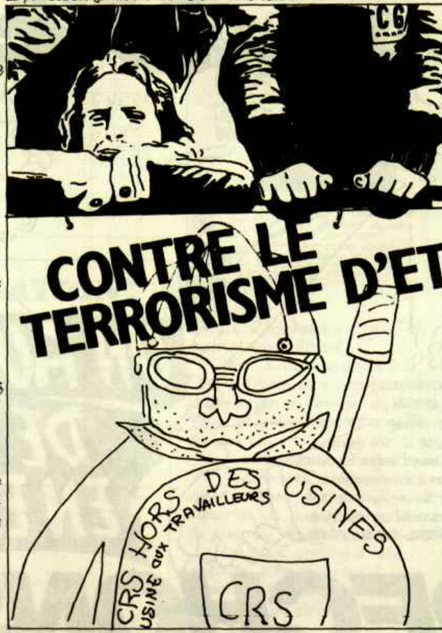
La panne des jeunes O.S. de Renault Flins devant les C.R.S.

Nous disons : Berlinguer assassin ! Défense des Brigades Rouges contre la répression ! A BAS LE TERRORISME D'ETAT !